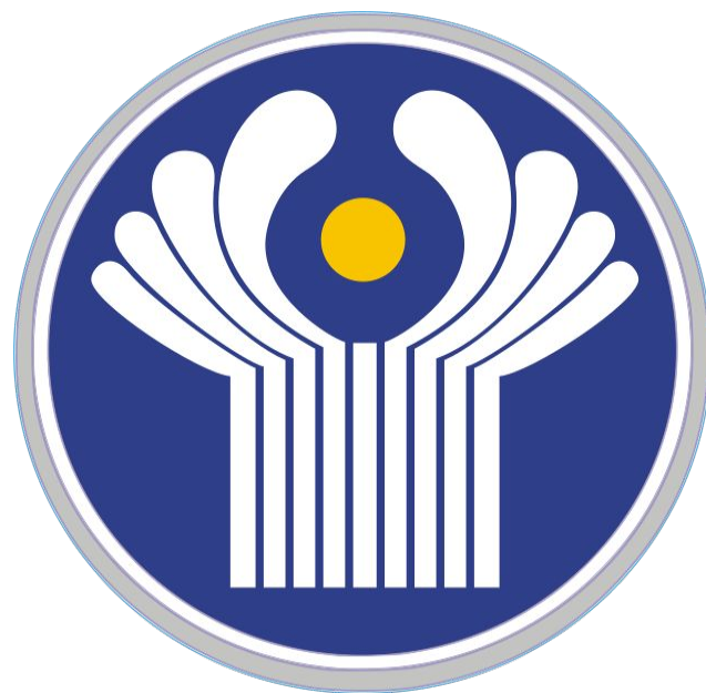
Флаг Содружества Независимых Государств (СНГ)