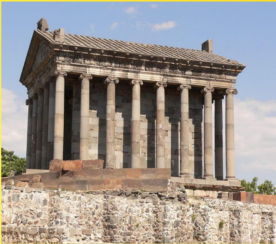
Храм бога Солнца в Гарни

Архитектура Армении имеет давние традиции. Крепость Гарни начали строить еще во II веке до нашей эры и продолжали застраивать в течение античной эпохи и в средние века. Главное место там занимал храм бога Солнца Митры (I век н.э.). Непрístupная цитадель защищала своих жителей от иноземных нашествий 1000 лет.