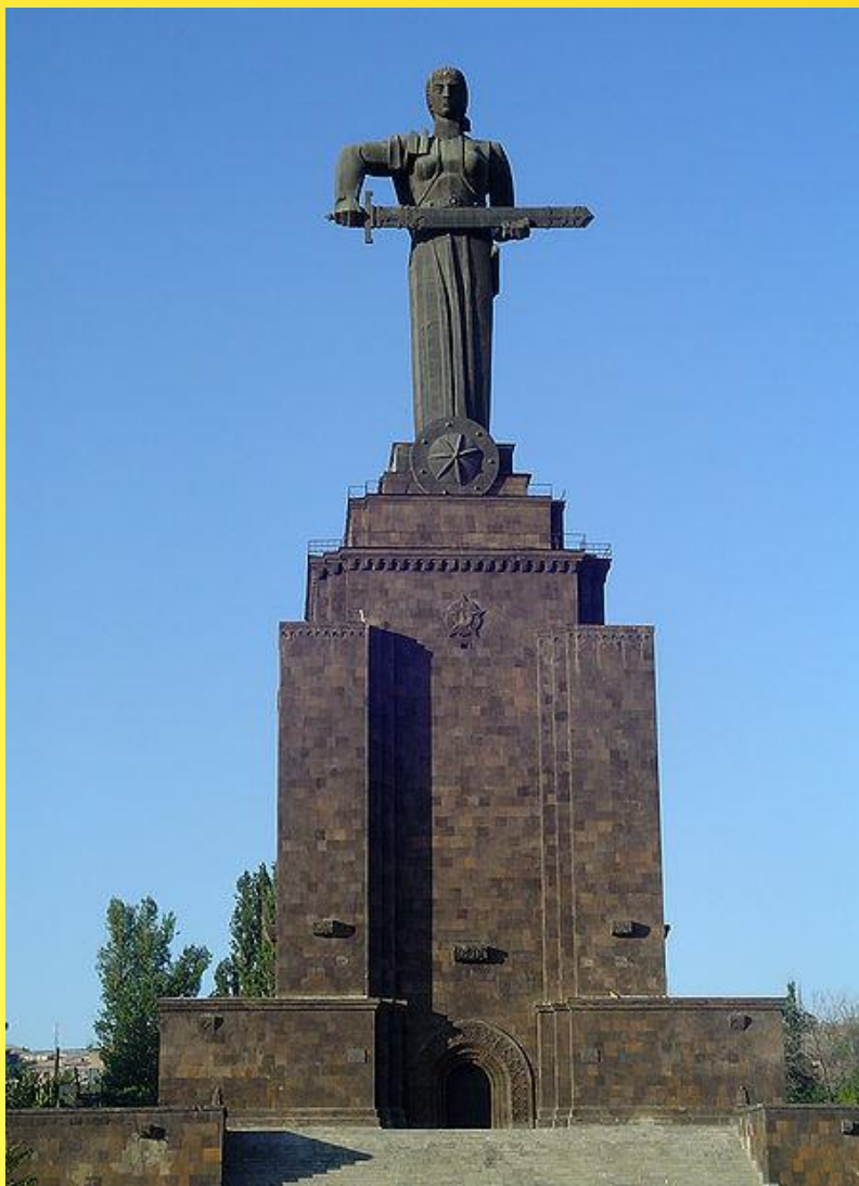
Мать - Армения

Мать-Армения — монумент в Ереване в честь победы Советского Союза в Великой Отечественной войне в Ереване. Высота 54 метра, выполнен из бронзы и гранита. Монумент, созданный скульптором Ара Арутюняном и архитектором Рафаелом Исраеляном, представляет собой образ матери, вкладывающей меч в ножны.