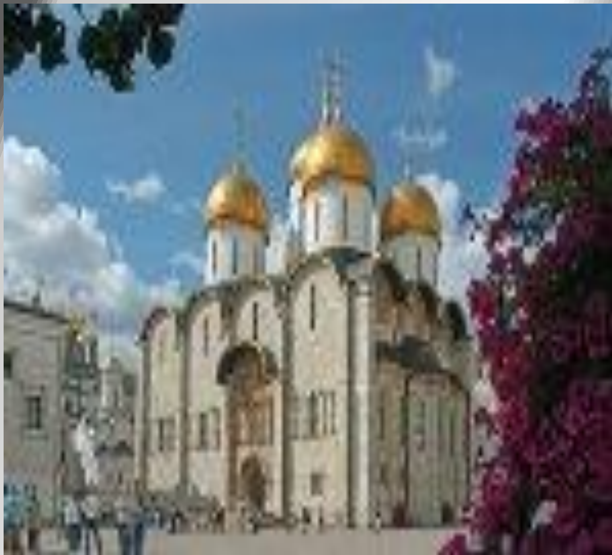
Успенский собор XV в.