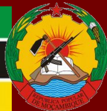
Флаг и герб Республики Мозамбик