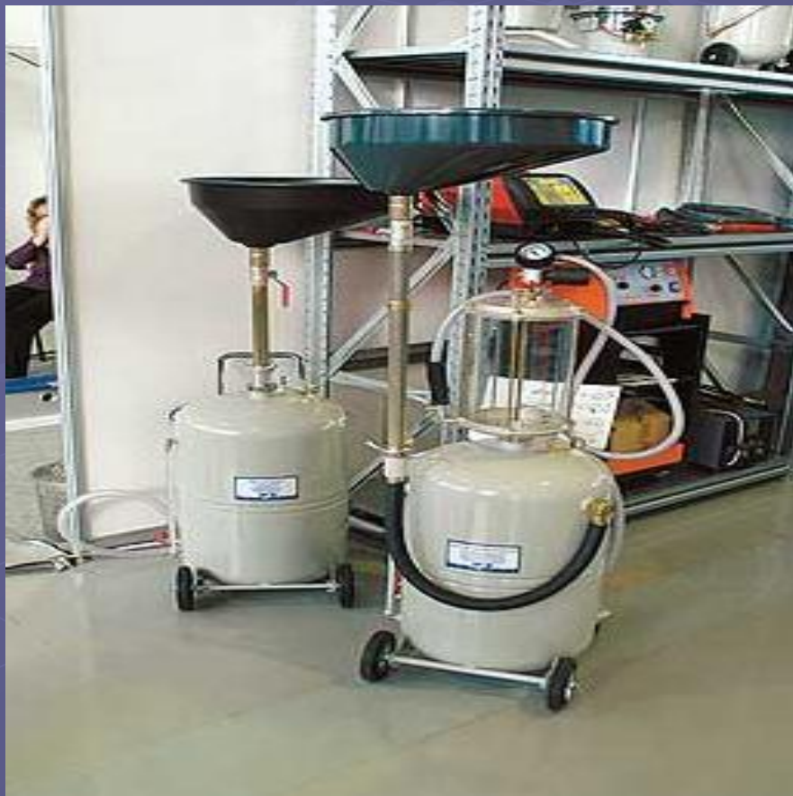
Нагнетатель автомобильных масел