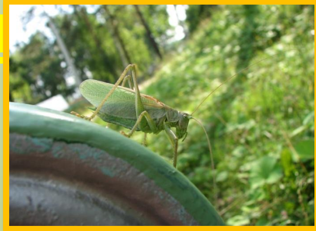
• Городские газоны