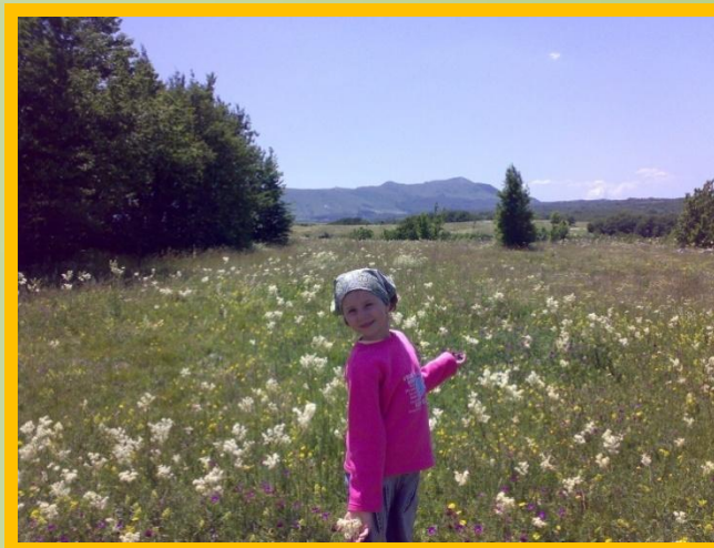
• Поля и луга