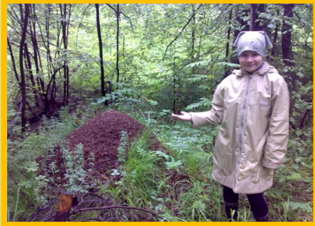
• Лесные полянки