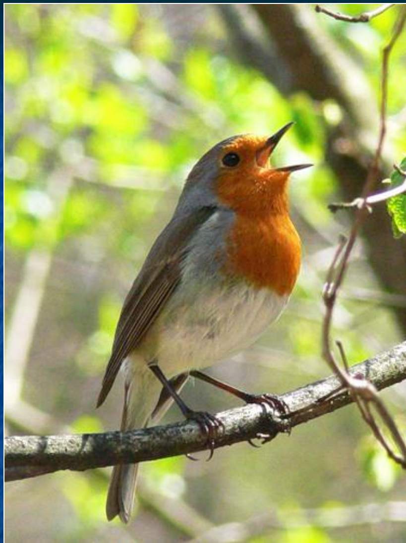
ЗАРЯНКА ( малиновка )