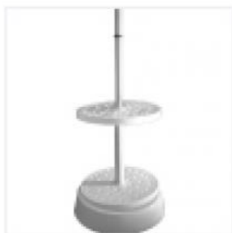
Штатив для Пипеток