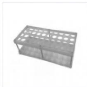
Штатив для Пробирок