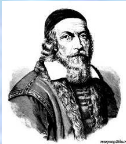
Ян Амос Каменский

«Считай несчастным тот день или тот час, в котором ты не усвоил ничего, ничего не прибавил к своему образованию»