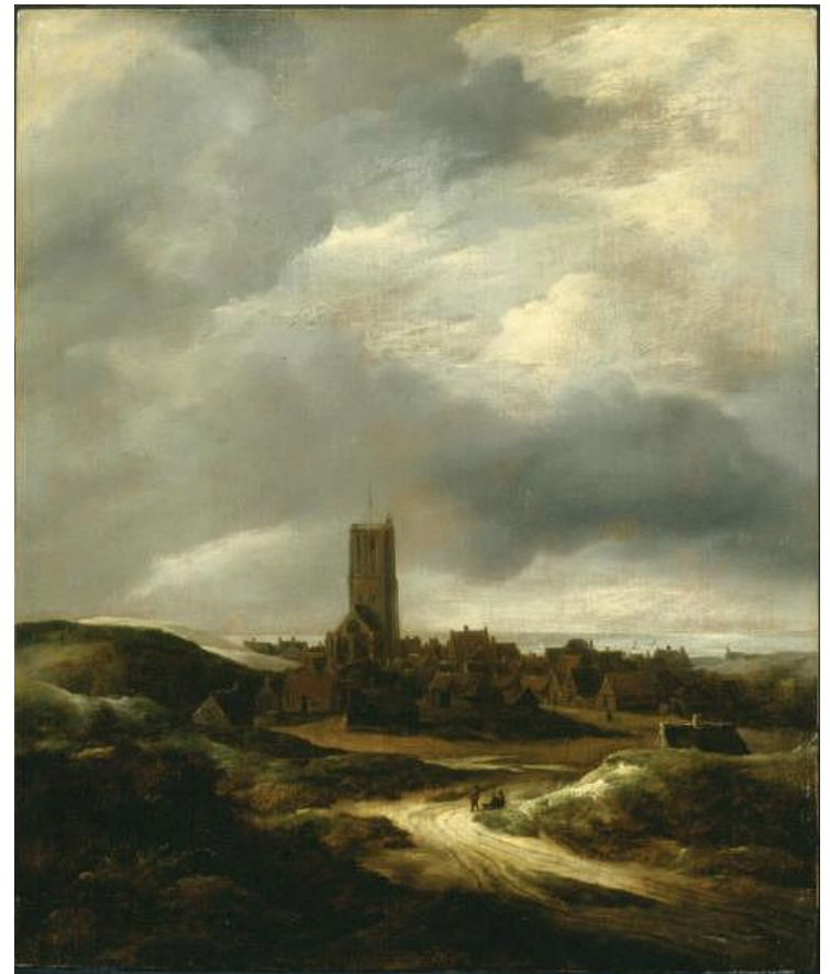
Якоб ван Рейсдал, «Вид деревни Эгмонт»

Вывод: стиль барокко построен на контрастах и асимметрии, тяготеет к грандиозности и пышной декоративности.