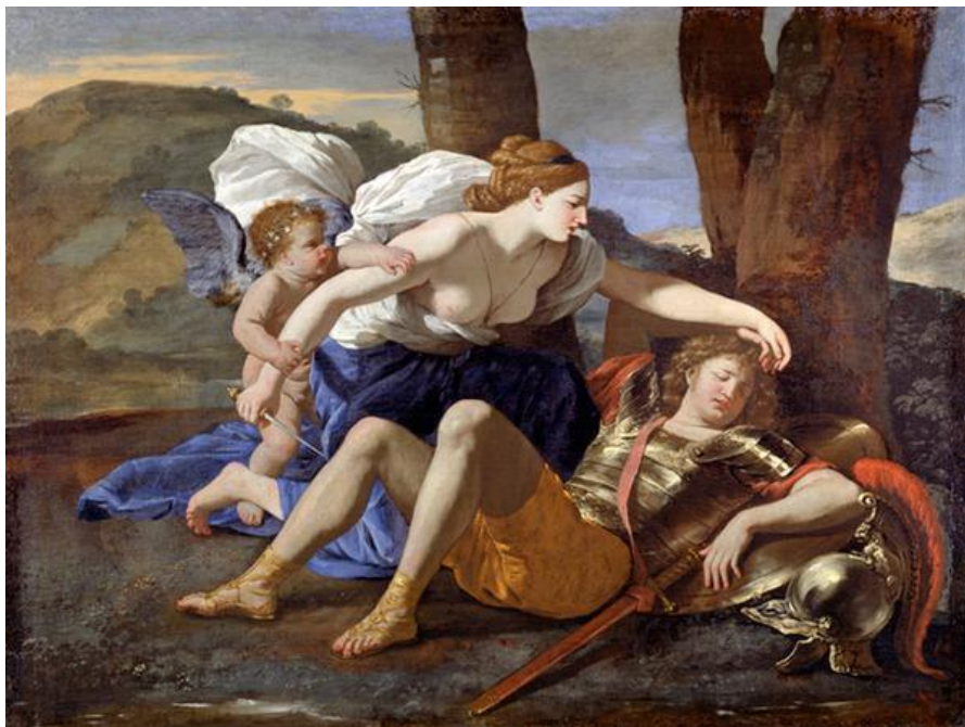
Никола Пуссен, «Ринальдо и Армида»