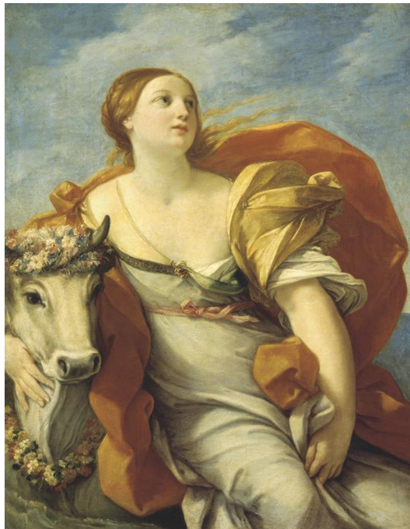
Гвидо Рени, «Похищение Европы»