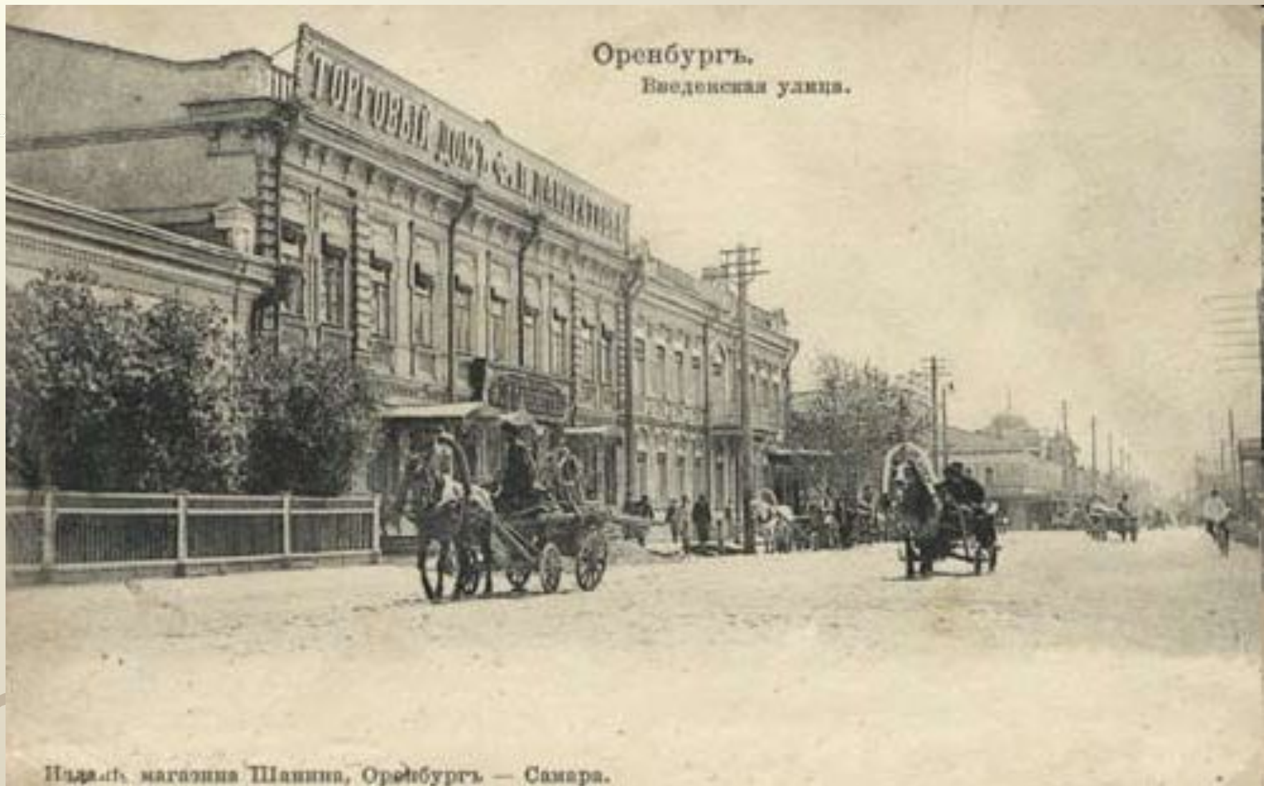
Оренбургъ. Введенская улица.