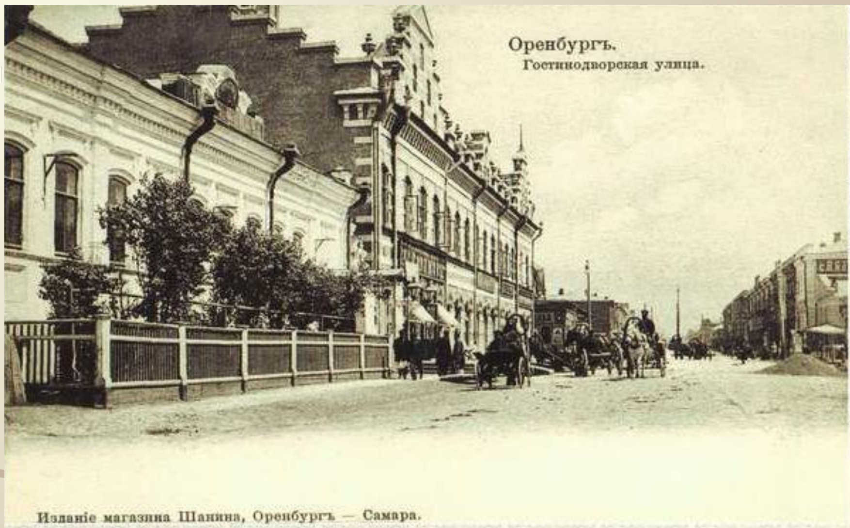
Оренбургъ. Гостинодворская улица.