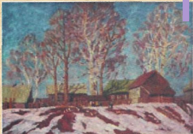
В. Телегин «Март»