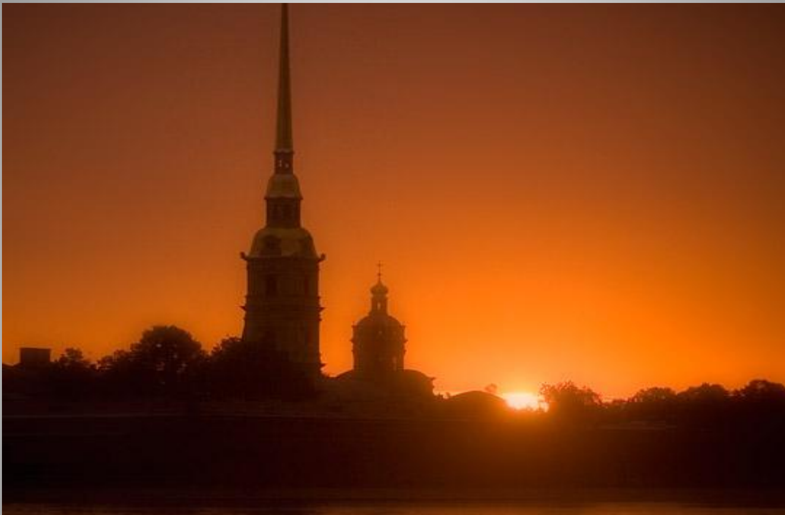
Петербург, Петропавловская крепость