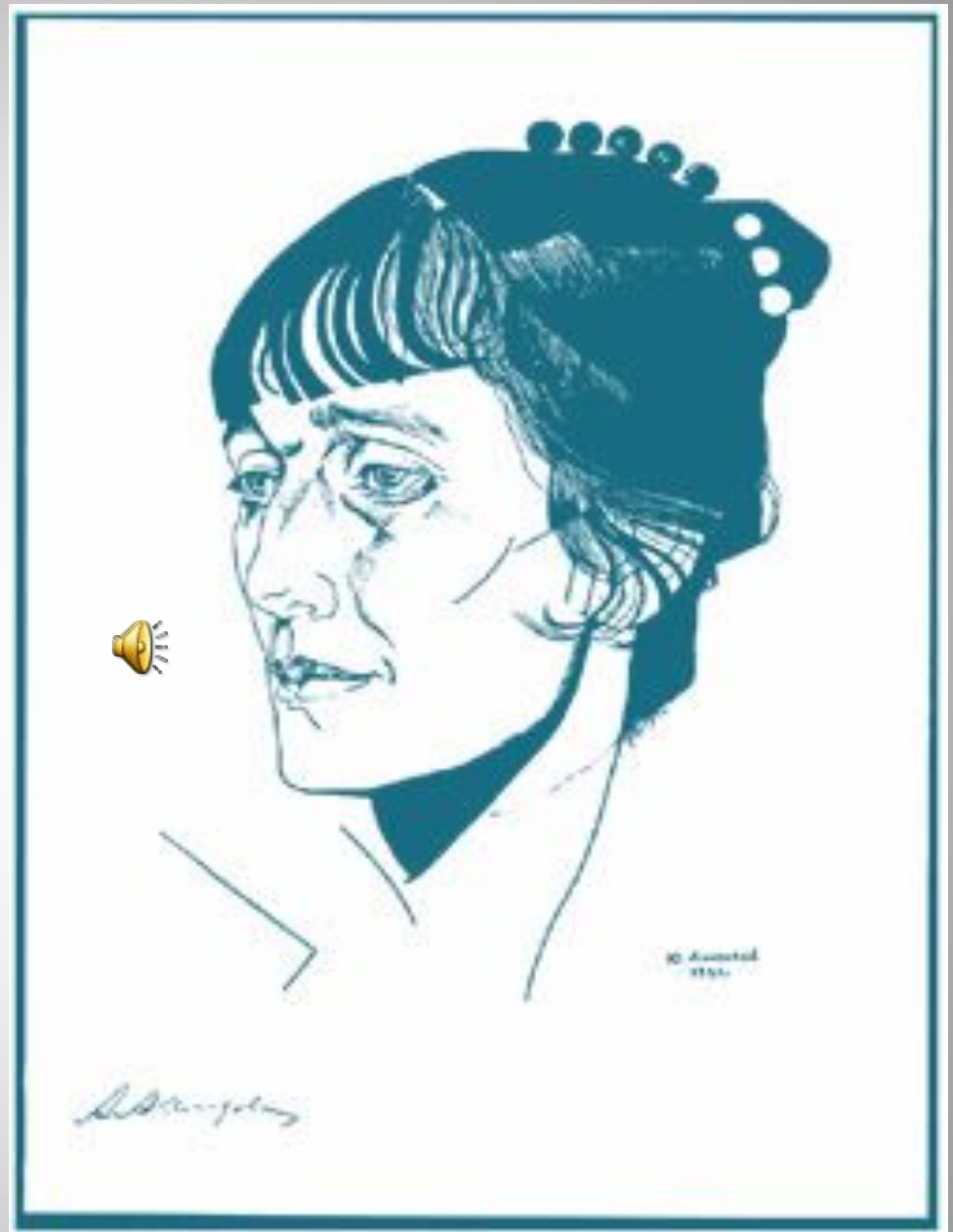
Анна Андреевна Ахматова (Горенко) 1889 -1966