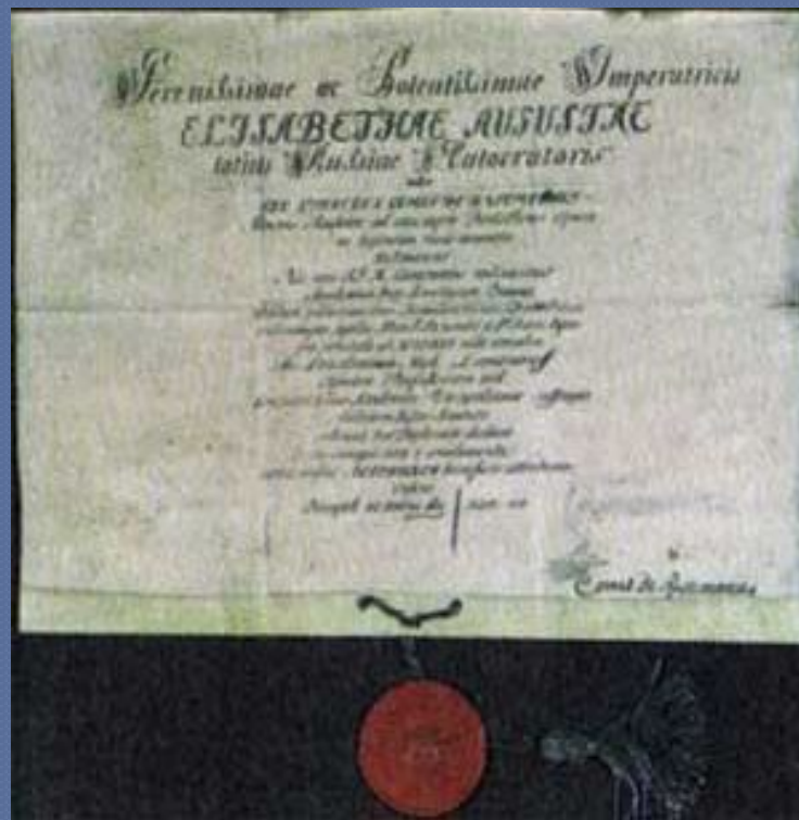
Диплом на звание профессора химии

Одним из первых важных начинаний химика явилась постройка в 1748 г. химической лаборатории Академии наук на Васильевском острове. Она стала первым в истории России исследовательским учреждением.