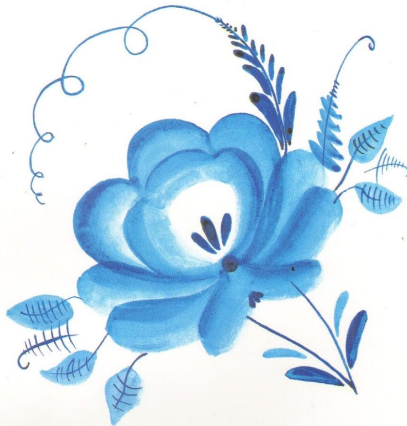
МАЗОК С ТЕНЬМИ В РОСПИСИ ПО ФАРФОРУ. ГЖЕЛЬ.