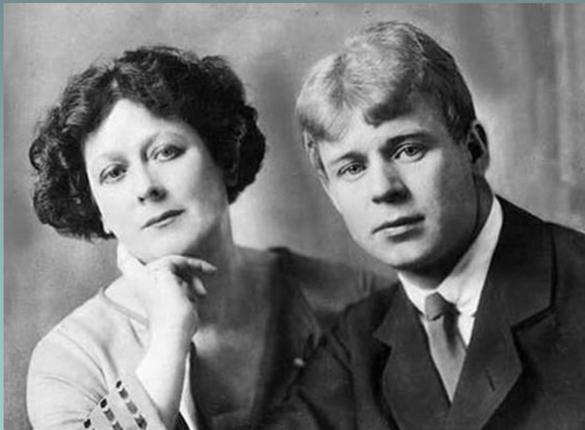
Сергей Есенин и Айседора Дункан 1923 г.