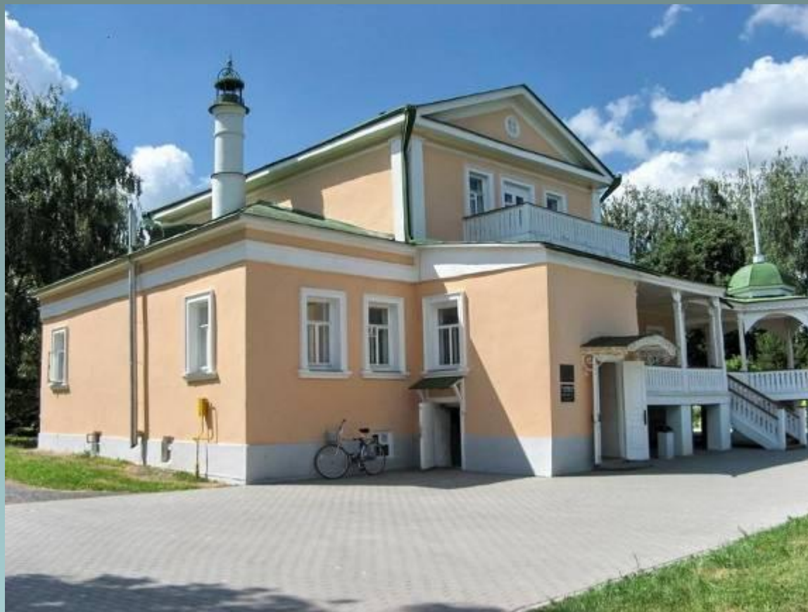
Музей Есенина в селе Константиново