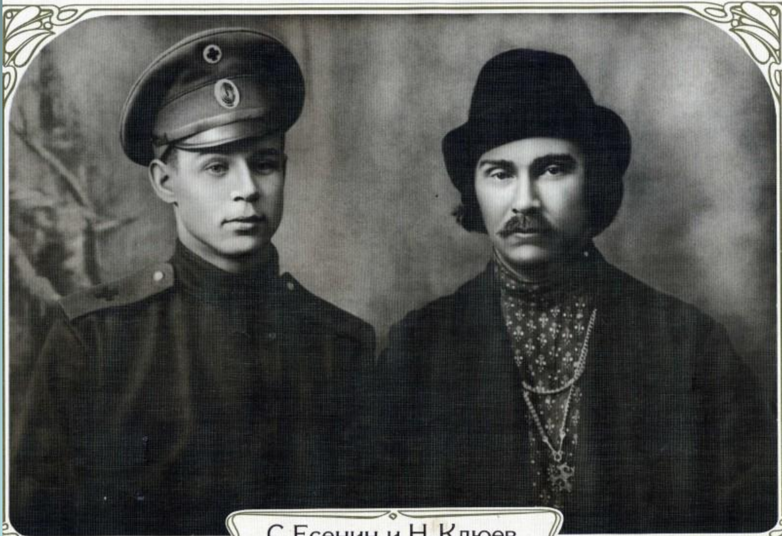
С.Есенин и Н.Клюев 1916 г.