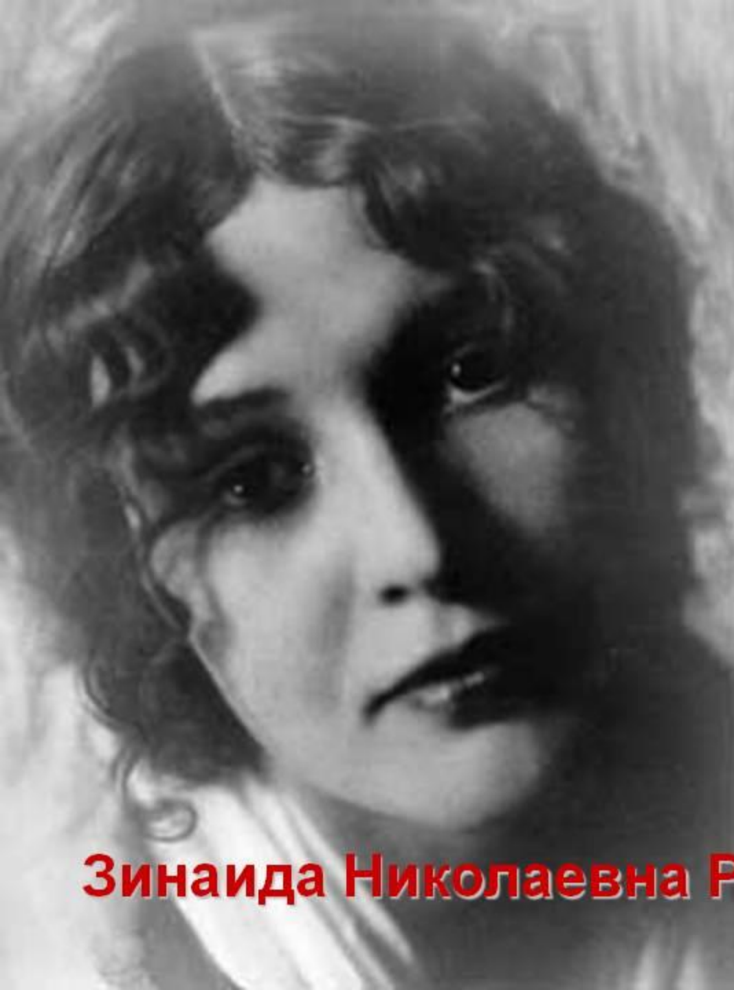
Зинаида Николаевна Райх

В 1917 ГОДУ Есенин влюбляется в красивейшую, нежную, образованную женщину