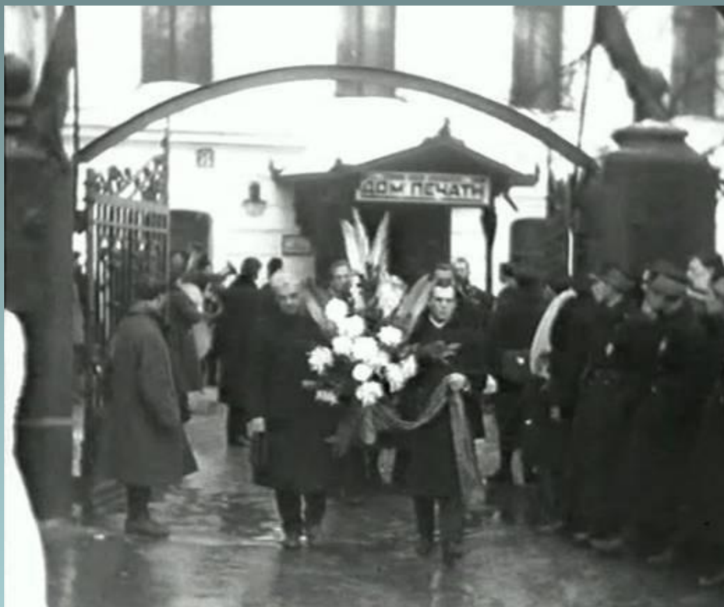
Похороны Сергея Есенина