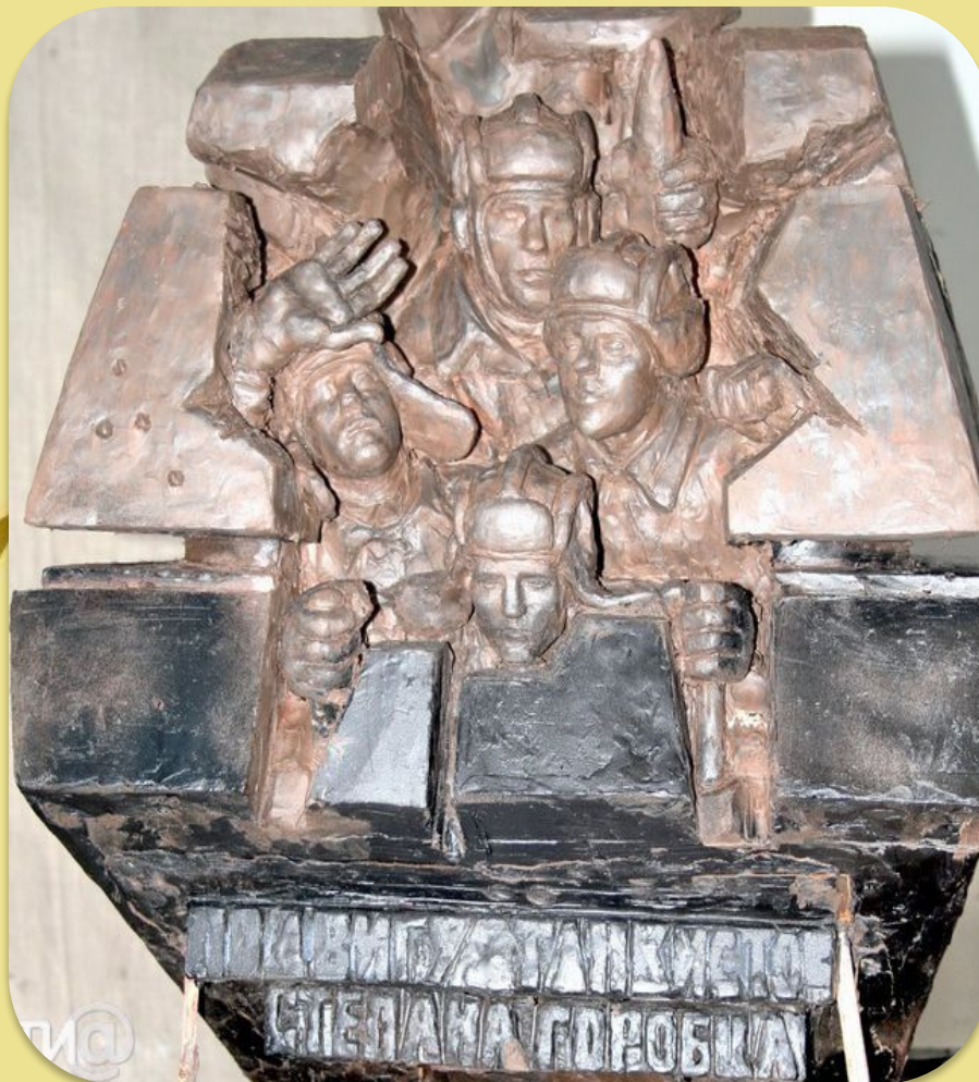
Памятник экипажу Степана Горобца в сквере на Комсомольской площади г. Твери