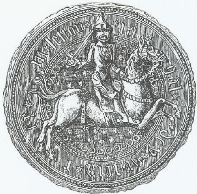
Lietuviškas Jogailos antspaudas