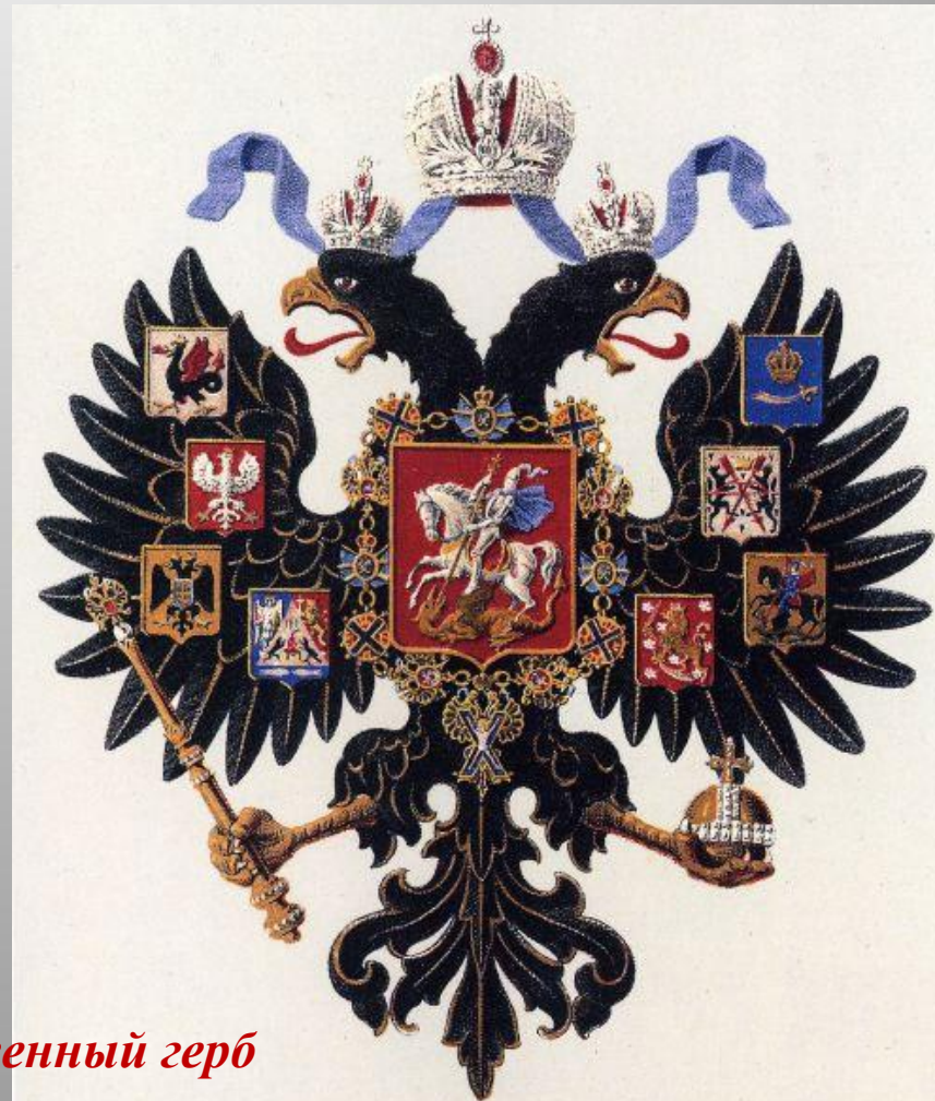
Малый государственный герб