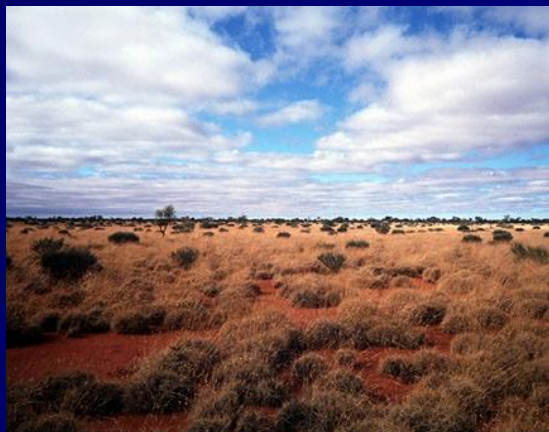
Большая Песчаная пустыня