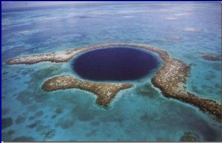
Большой Артезианский Бассейн