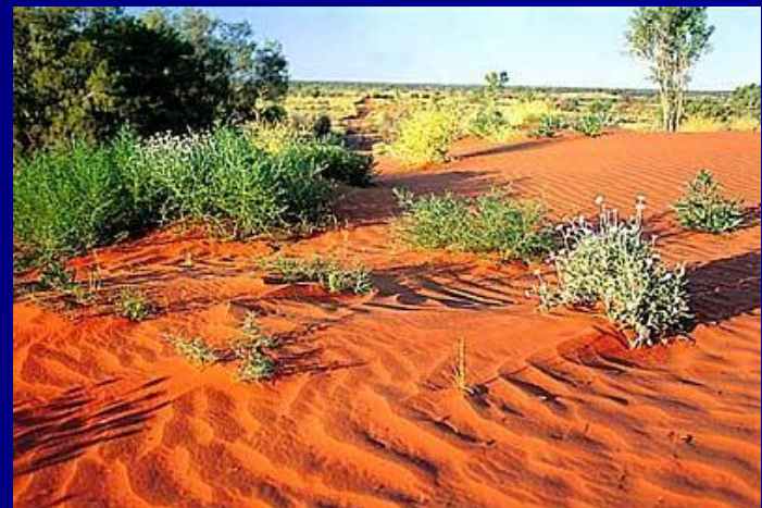
Большая пустыня Виктория