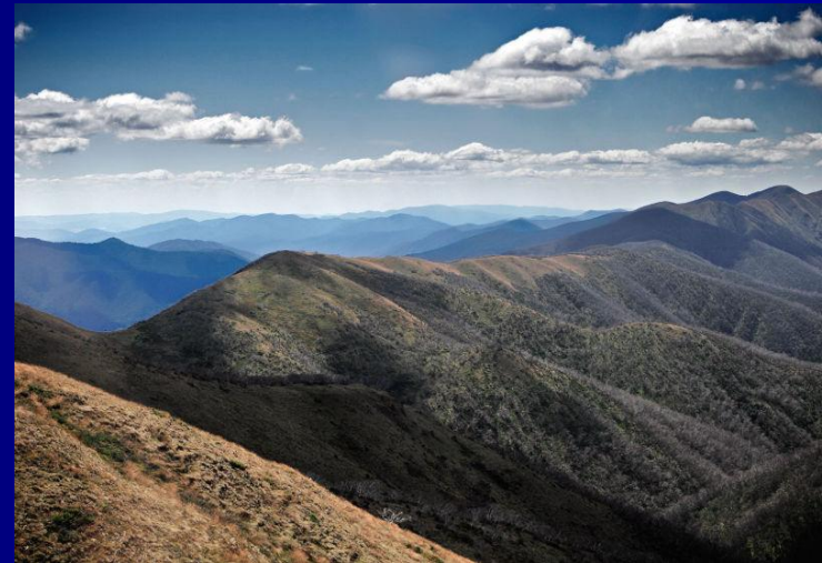
Большой Водораздельный хребет