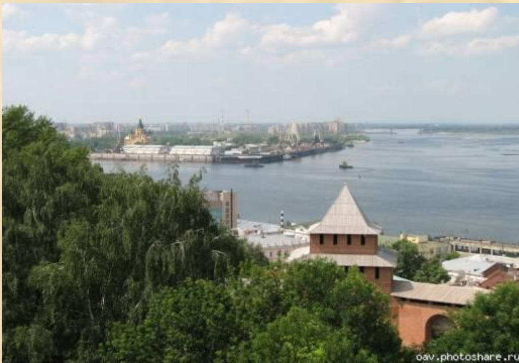
«Стрелка» у слияния Волги и Оки.