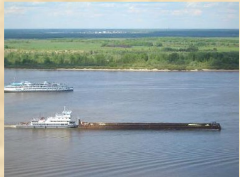
Судоходство на Волге.

Волга – это река-труженица, артерия жизни, мать русских рек, воспетая нашим народом.