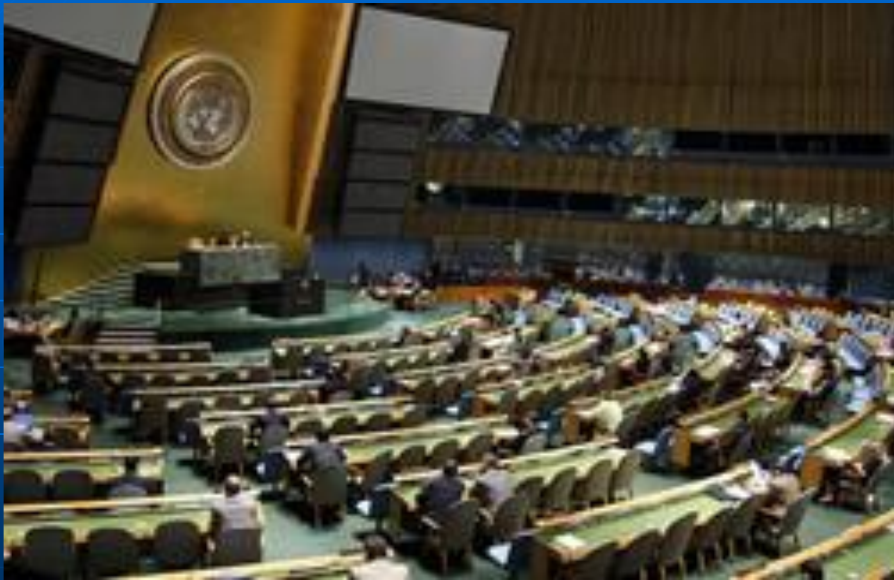
Сессия Генеральной Ассамблеи. Июль 2008 года.