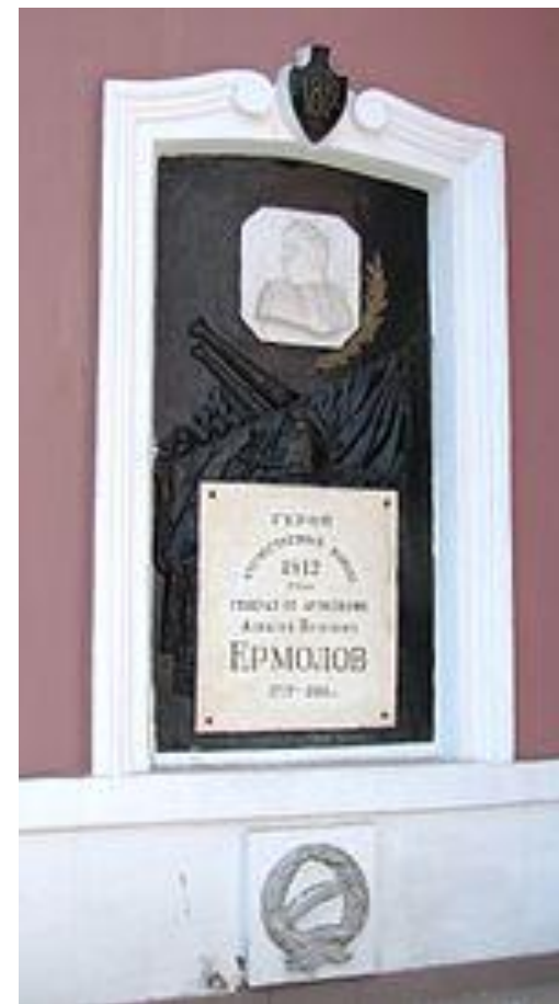
Фамильная усыпальница Ермоловых в Свято-Троицкой церкви в Орле