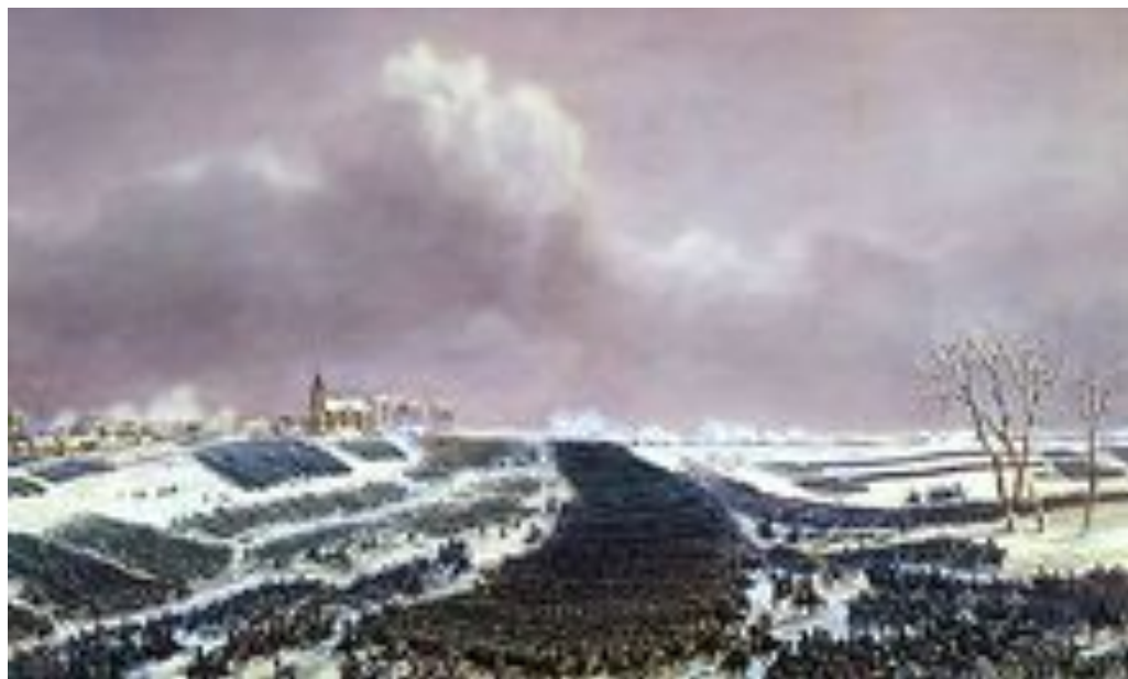
Битва при Прейсиш-Эйлау. (Февраль 1807 г.)

В 1805 году участвовал в русско-австро- французской войне, где русскими войсками командовал Михаил Кутузов