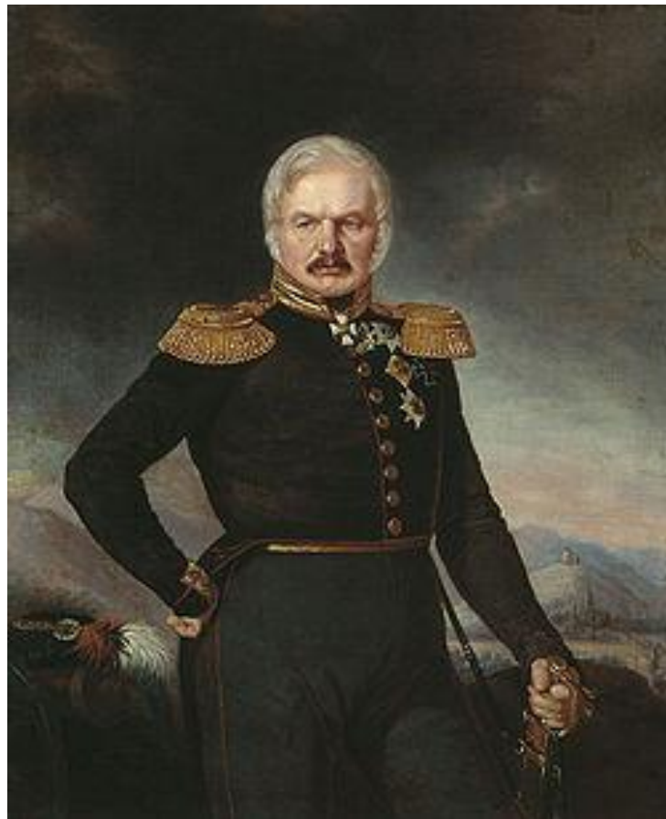
Портрет А. П. Ермолова кисти П. Захарова-Чеченца, примерно 1843 год.