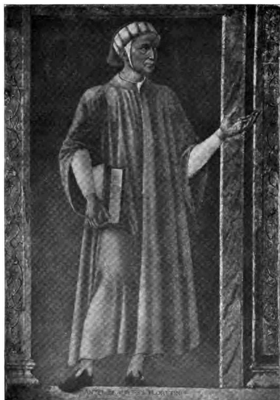
Д А Н Т Е.

(Firenze. Museo Nazionale. Ritratto di Dante Allighieri, Giotto, 1266—1337).