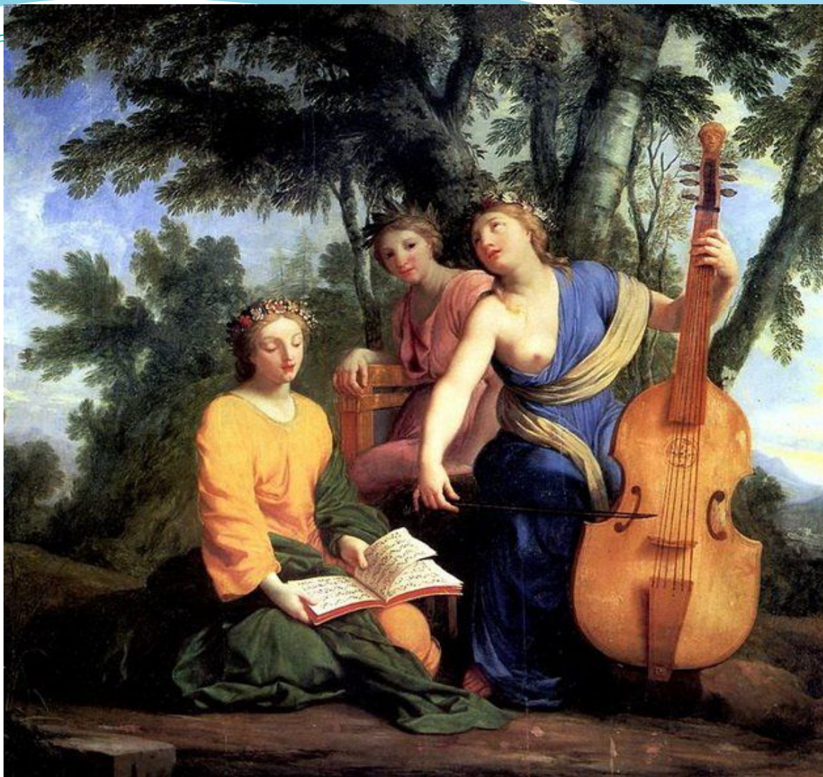
Музы Мельпомена, Эрато, Полигимния