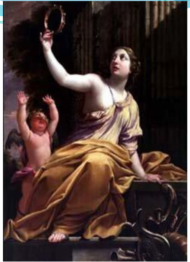
Эрато — муза любовной поэзии.