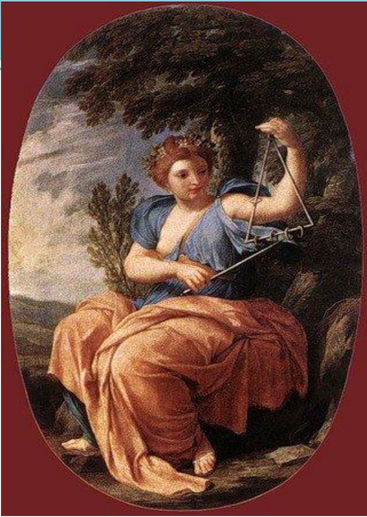
Терпсихора — муза танца.