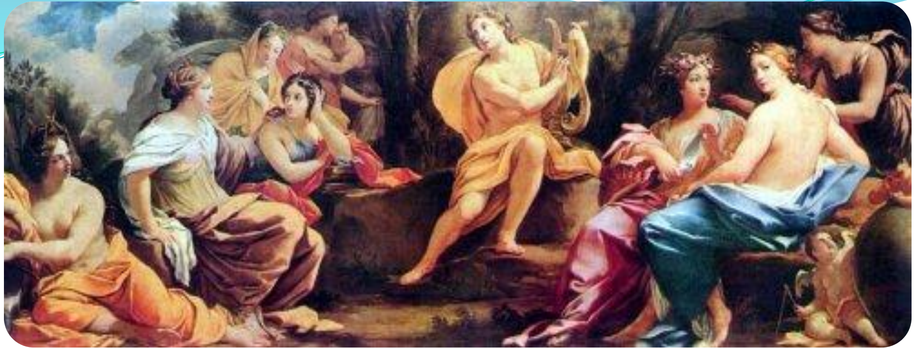
Аполлон и девять муз Гюстав Моро, 1856