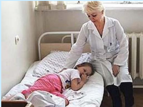
Больницы, поликлиники, аптеки