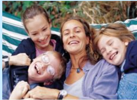
Нормальная влажность воздуха 60 %