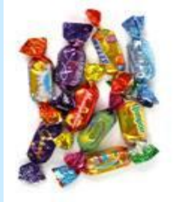
Производство тканей, конфет, табака и др.