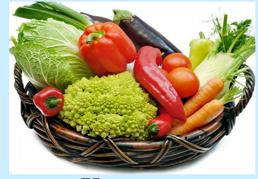
Хранение овощей, фруктов и др.