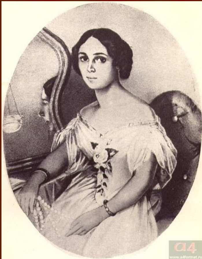
Е.И. Денисьева. Художник Иванов. 1850-е