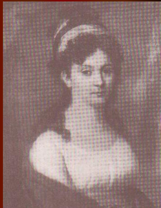
Е.Л.Тютчева, мать поэта