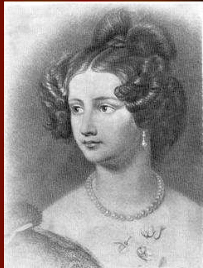
Амалия Крюденер. Фотография с портрета маслом работы художника И.Штилера. 1838 г