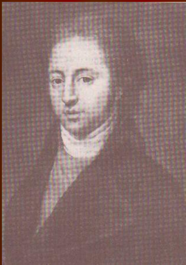
И.Н.Тютчев, отец поэта