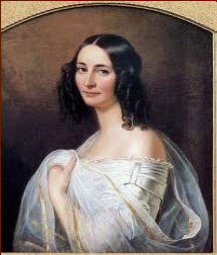
2-ая жена Э. Дернберг