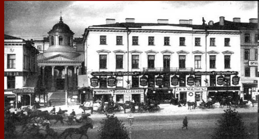
"дом Армянской церкви"

3 июля 1854 года Тютчев сообщает жене о квартире в доме Армянской церкви на Невском проспекте («четырнадцать прекрасных комнат с паркетными полами»)