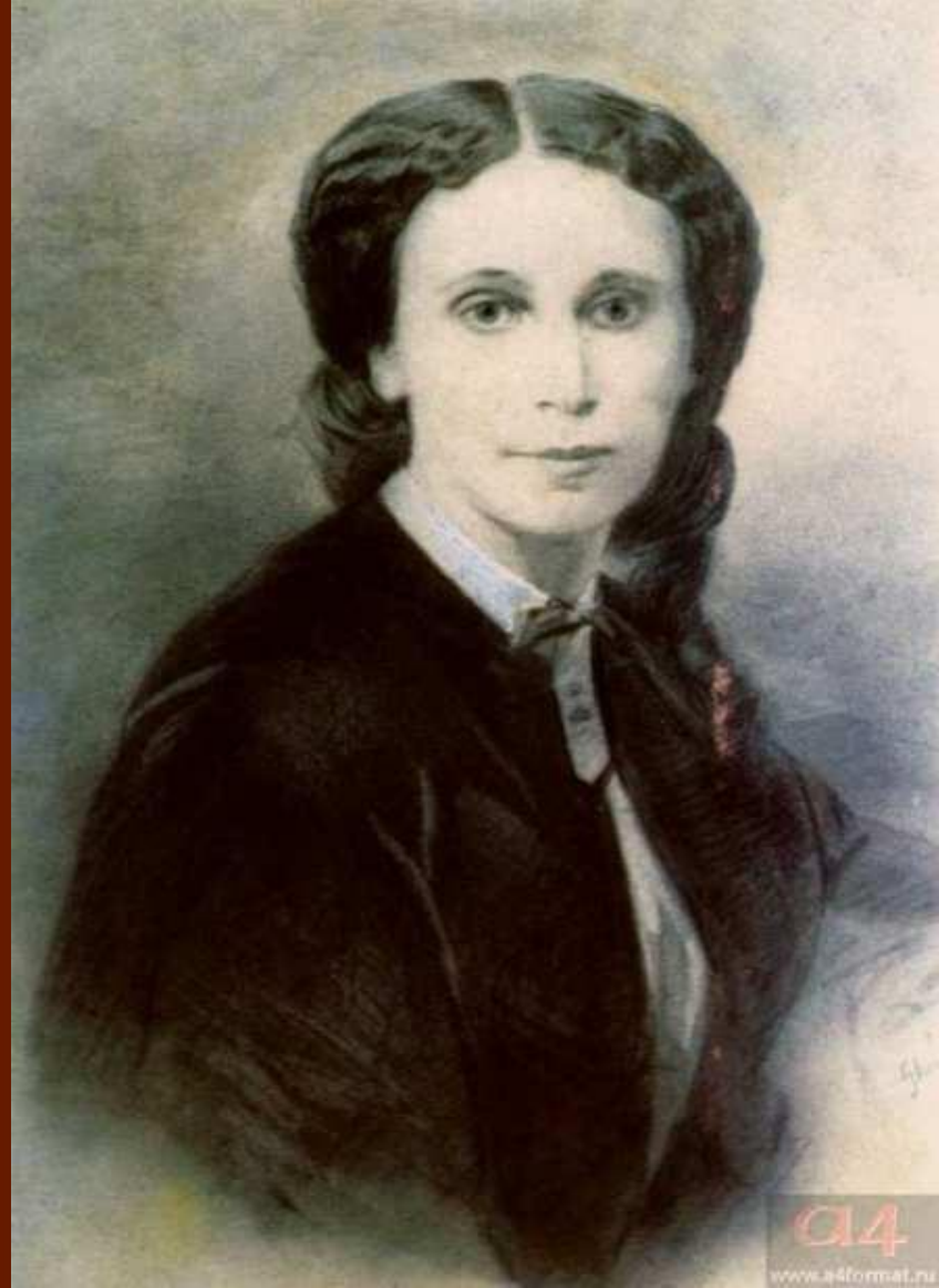
Е.А. Денисьева. Фото начала 1860-х