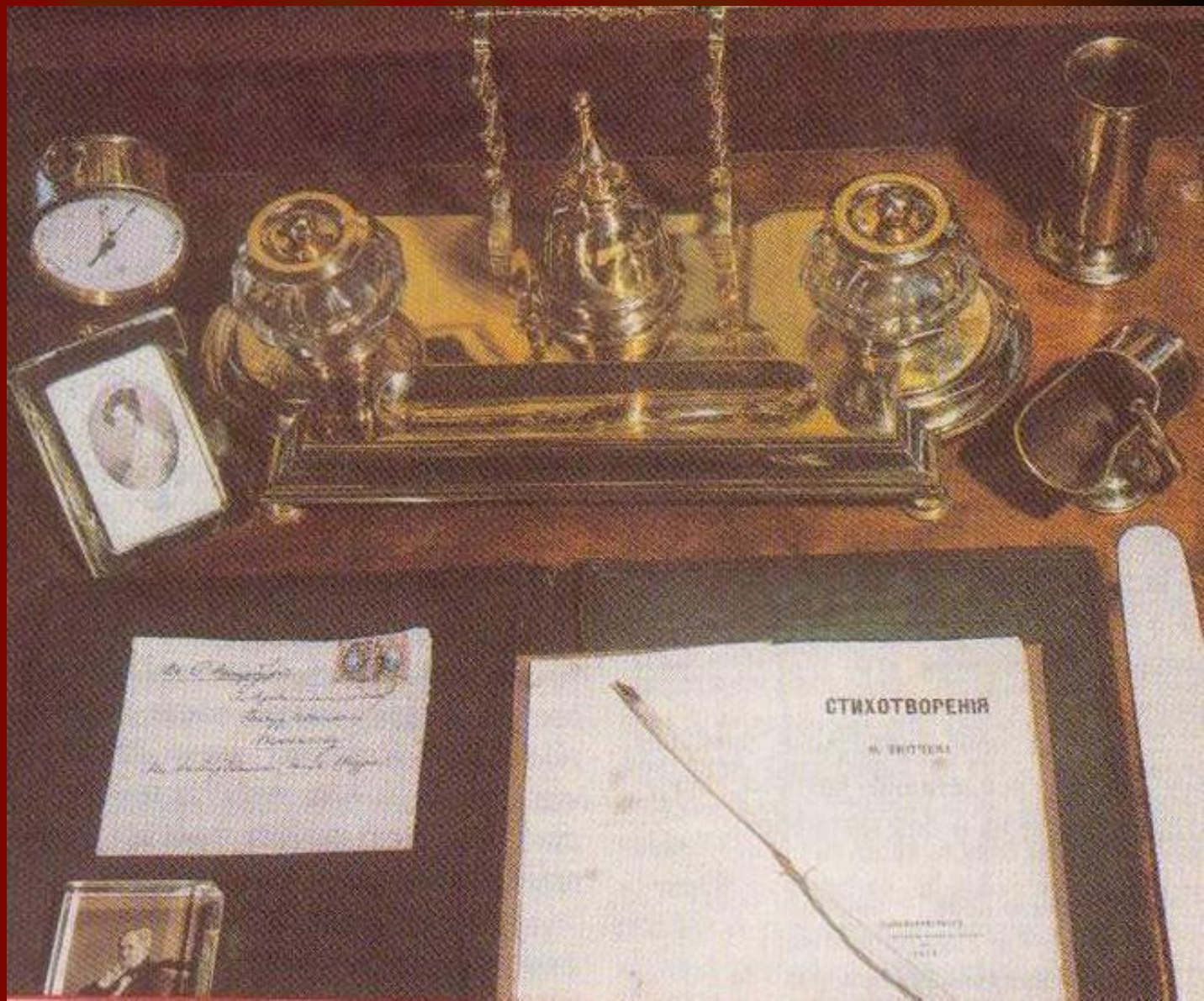
Личные вещи Ф.И.Тютчева. Музей-усадьба Мураново