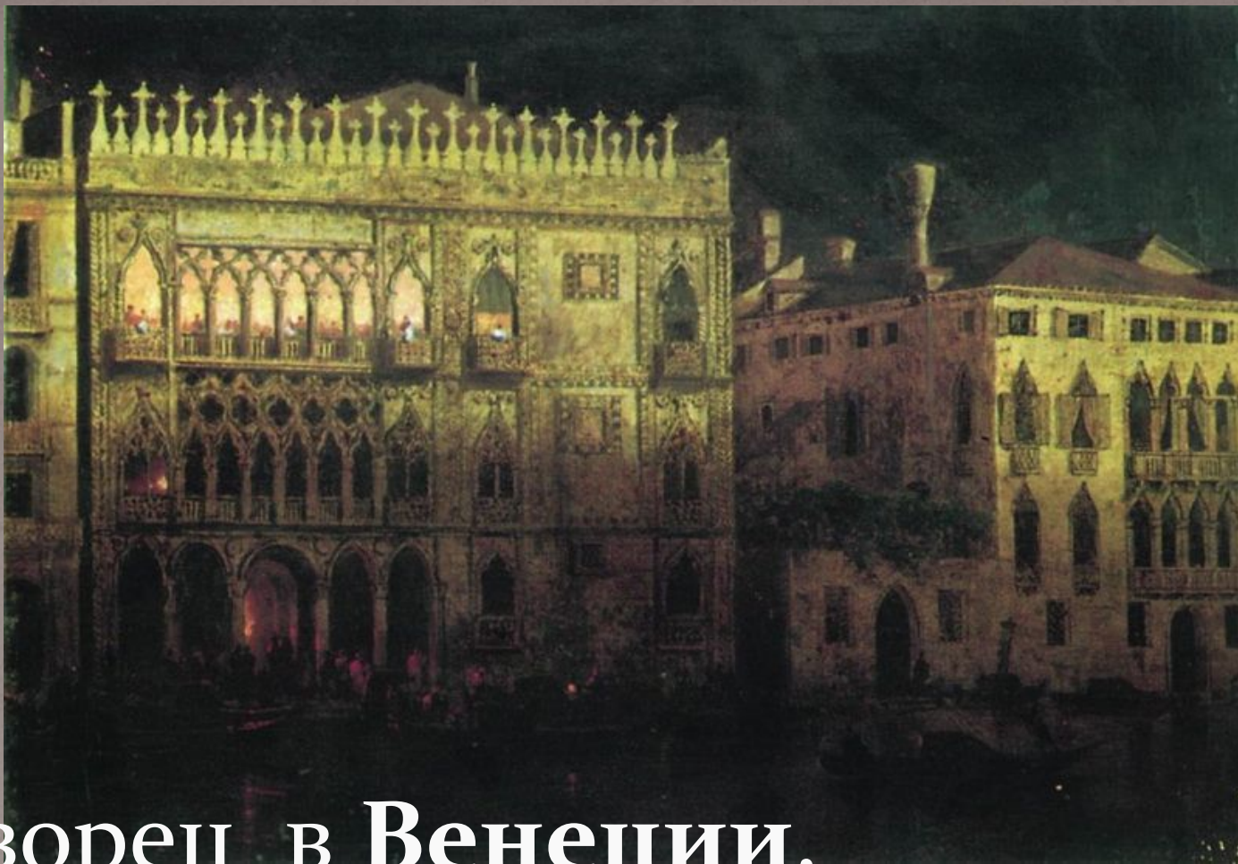
Дворец в Венеции, Айвазовский