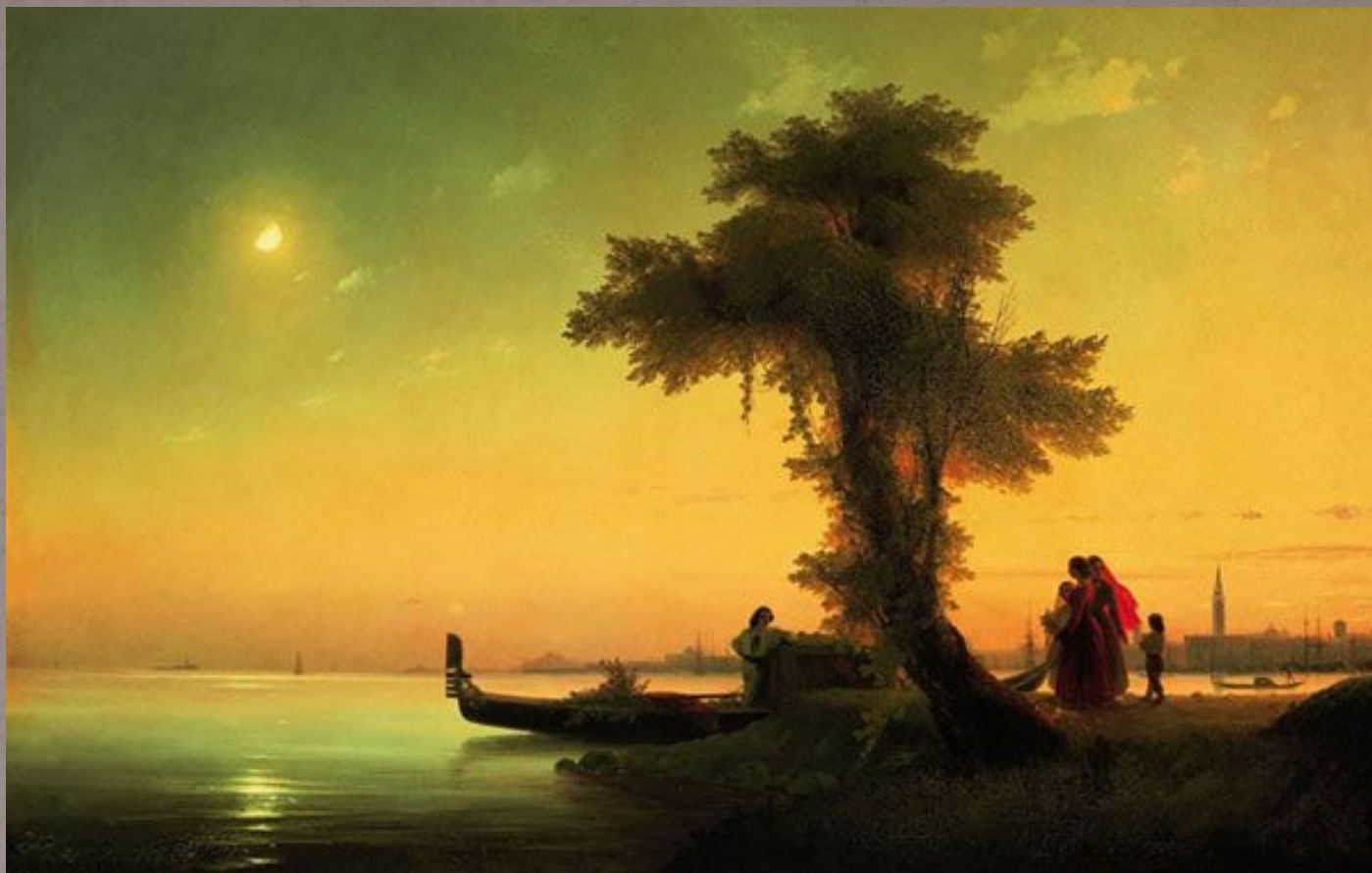
Айвазовский «Венецианская лагуна»