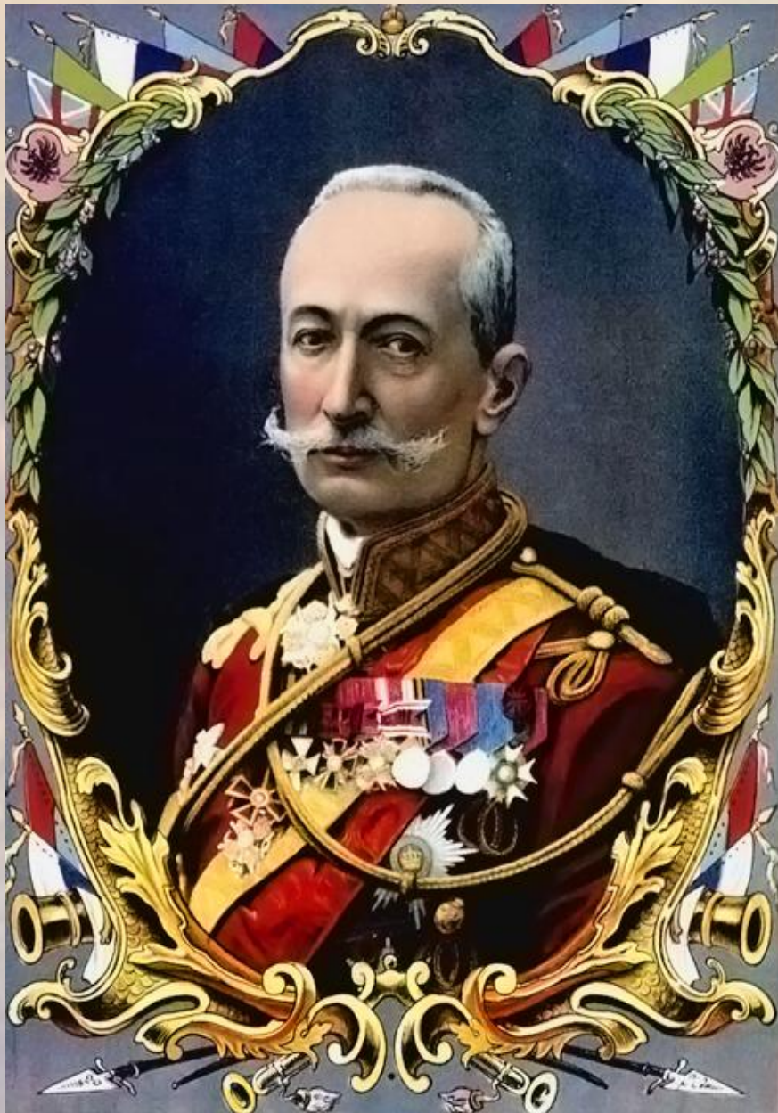
Литография. Типография М.Д. Сытина. Москва, 1916 г.

Генеральское прошлое послужило причиной ареста Брусилова органами ЧК в августе 1918 г. Благодаря ходатайству сослуживцев генерала, уже служивших в Красной Армии, Брусилов был вскоре освобожден, но до декабря 1918 г. находился под домашним арестом. В это время его сын, бывший офицер-кавалерист, был призван в ряды РККА. Честно сражавшийся на фронтах Гражданской войны, он в 1919 г. во время наступления войск генерала Деникина на Москву попал в плен и был повешен.