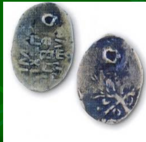
Серебряная гривна, найденная в Таббовской губернии в 1865 г.