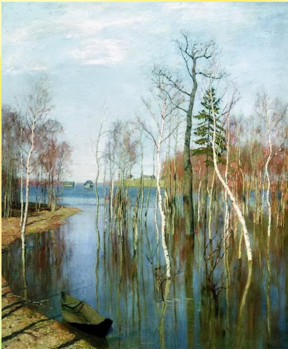
ИСААК ЛЕВИТАН Весна- большая вода