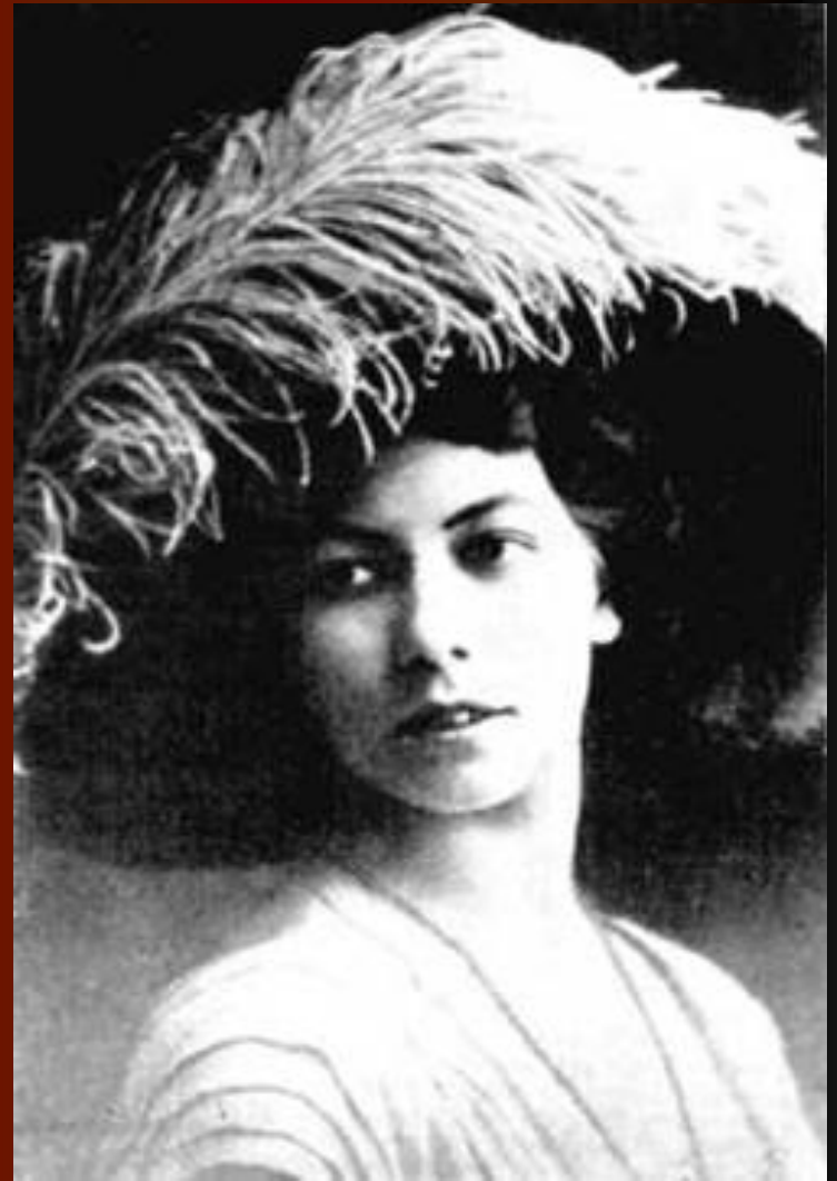
Бронислава Нижинская (1891-1972)