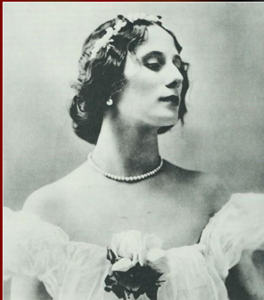
Анна Павлова – Великая русская балерина