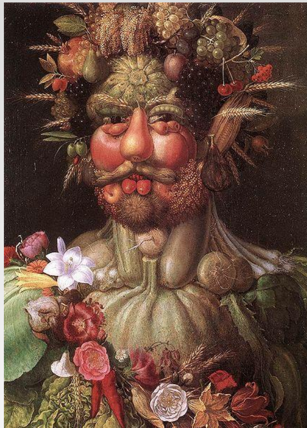
Портрет Рудольфа II в образе Вертумна