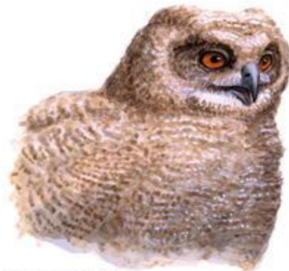
птенец в мезоптиле