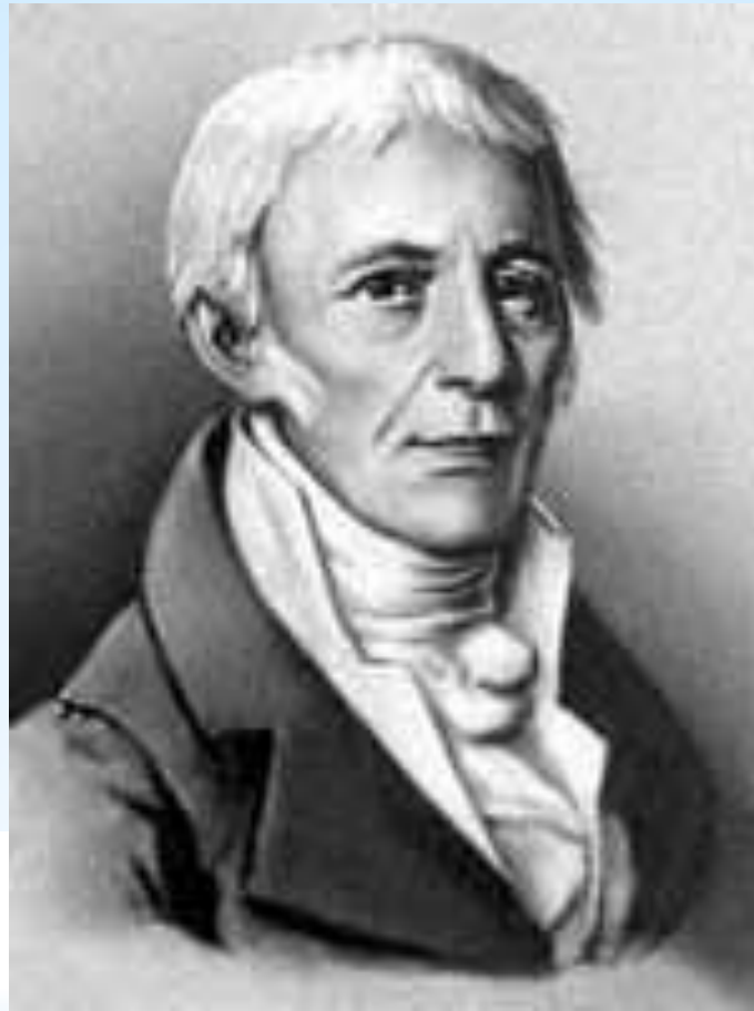
Жан Батист Пьер Антуан Де Моне Шевалье де Ламарк (Lamarck) (01.08.1744, Базантен – 18.12.1829, Париж) французский естествоиспытатель.