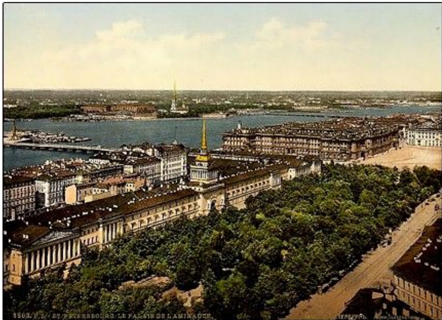
1503, P. R. - ST. PETERSBURG - LE PALAIS DE L'AMIRALTE.