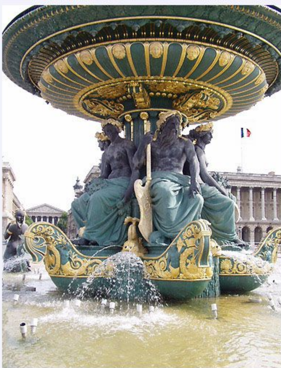
Архитектор Гитторф. Фонтан французских рек