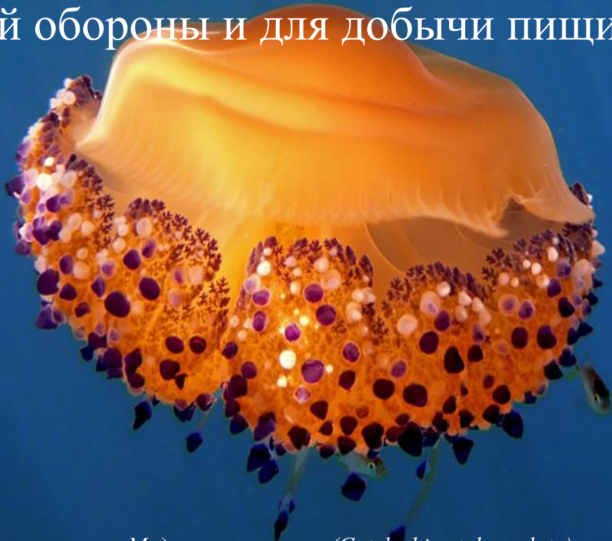
Медуза котилориза (Cotylorhiza tuberculata)

В стрекательных клетках содержится «обжигашее» вещество, служащее для целей обороны и для добычи пищи.