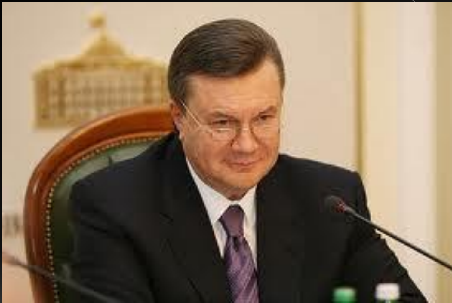
Янукович Виктор Фёдорович