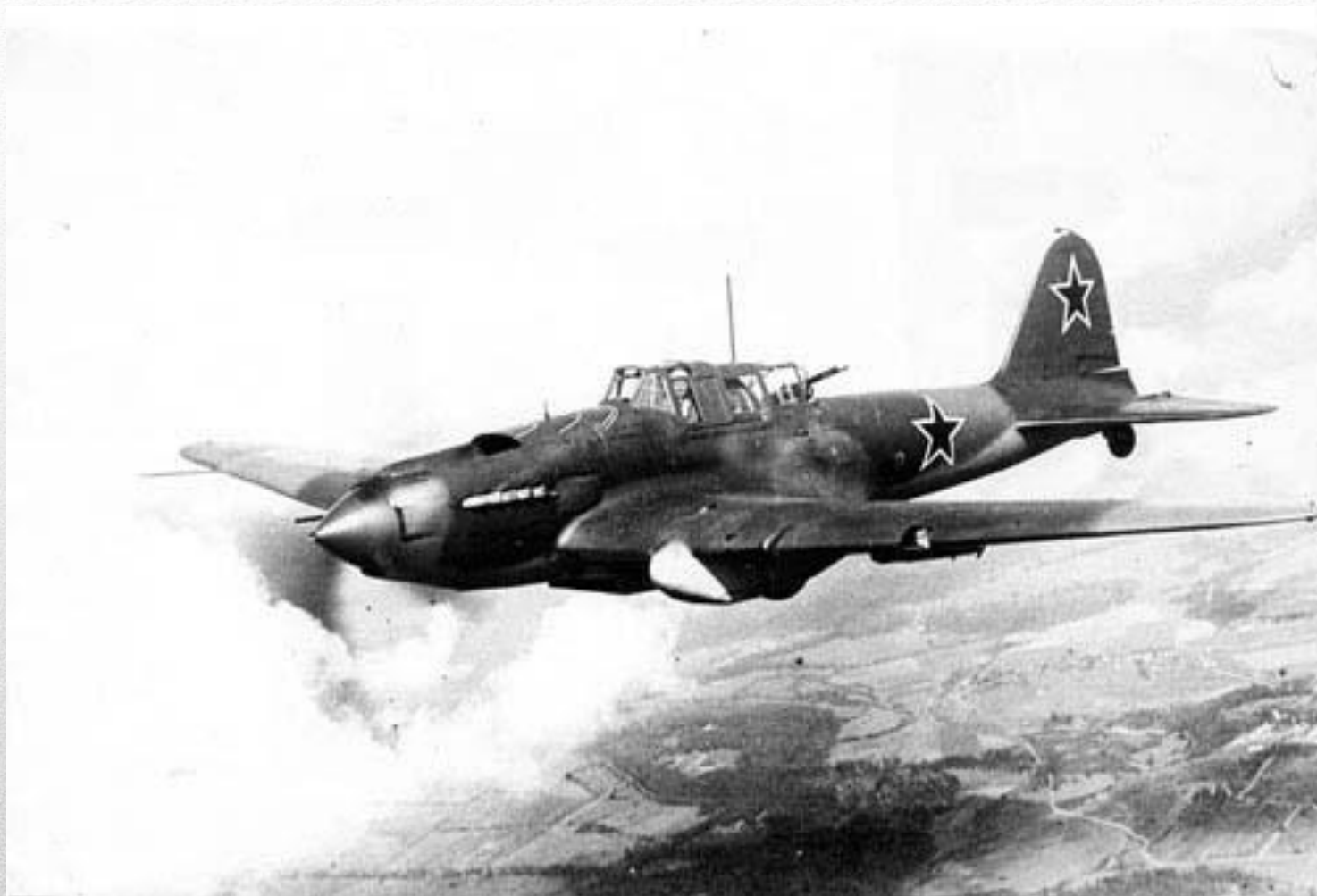
Скоростной штурмовик ИЛ-2