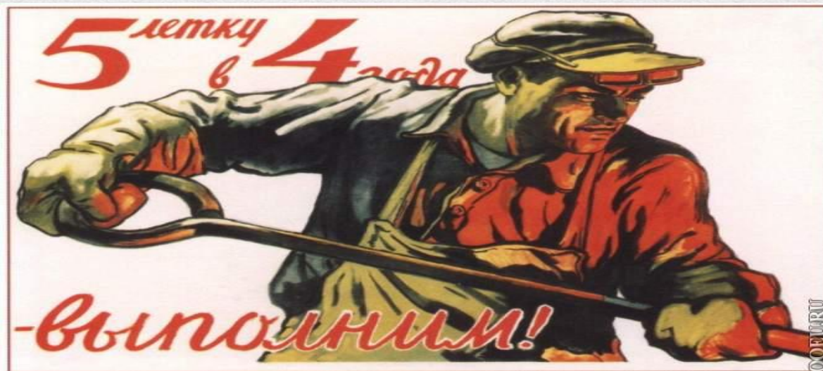
351. Иванов В. 5-летку в 4 года — выполним! 1948