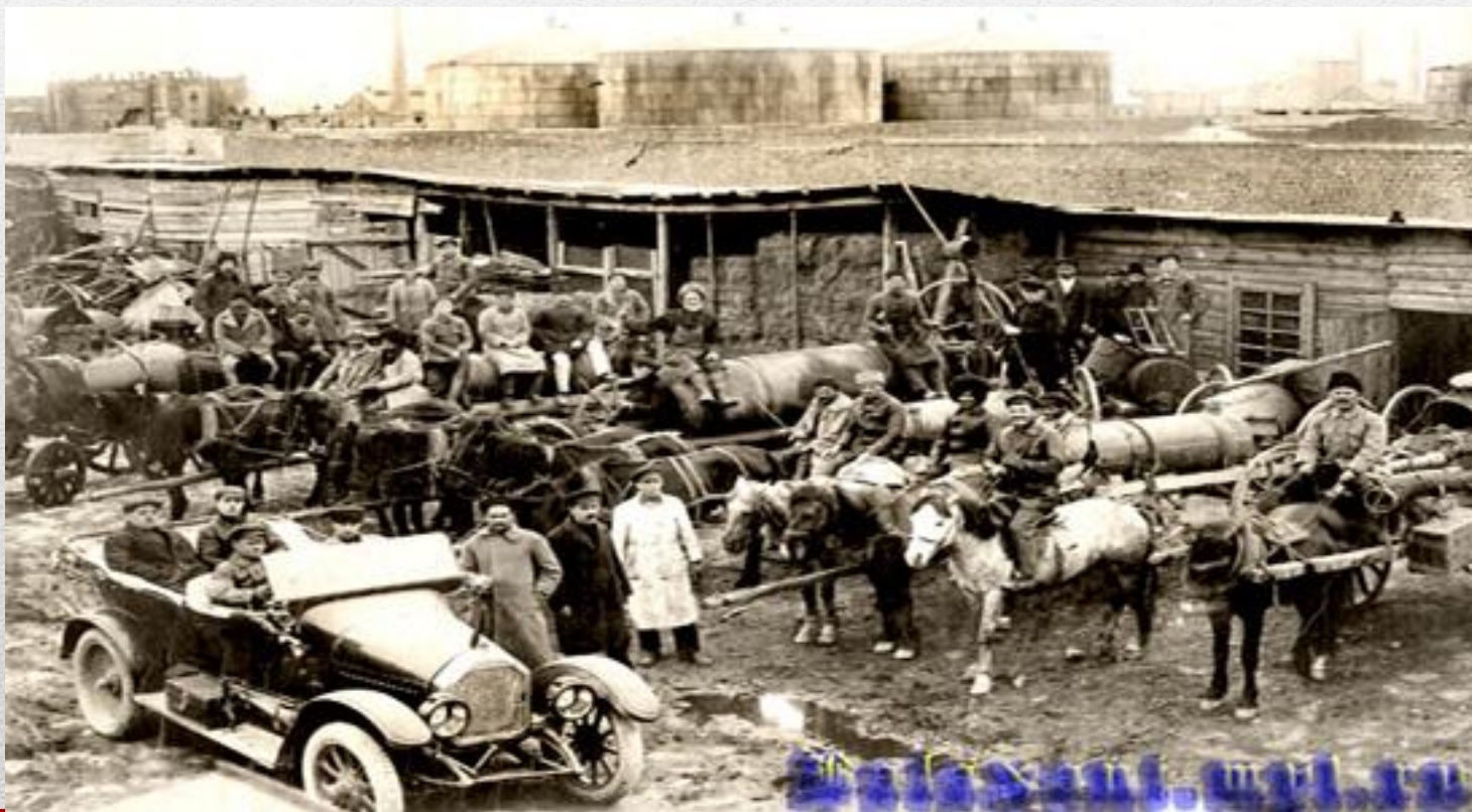
Нефтяная промышленность в годы военных пятилеток