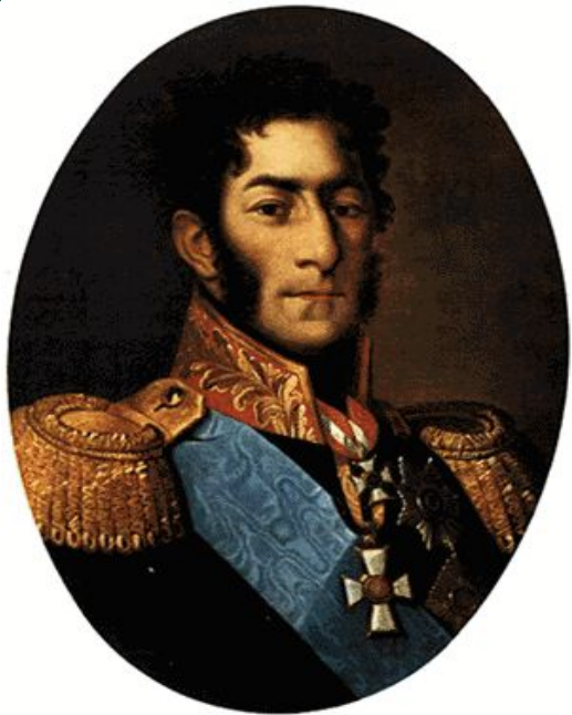
П. И. Багратион