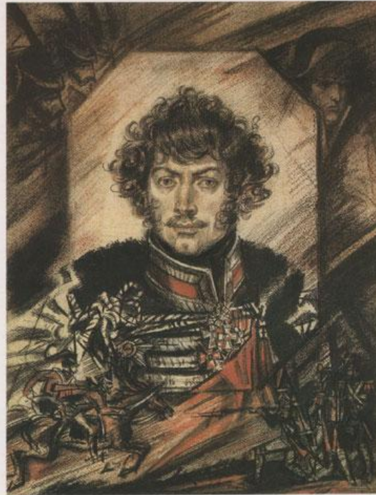
Александр Никитич Сеславин 1780—1858