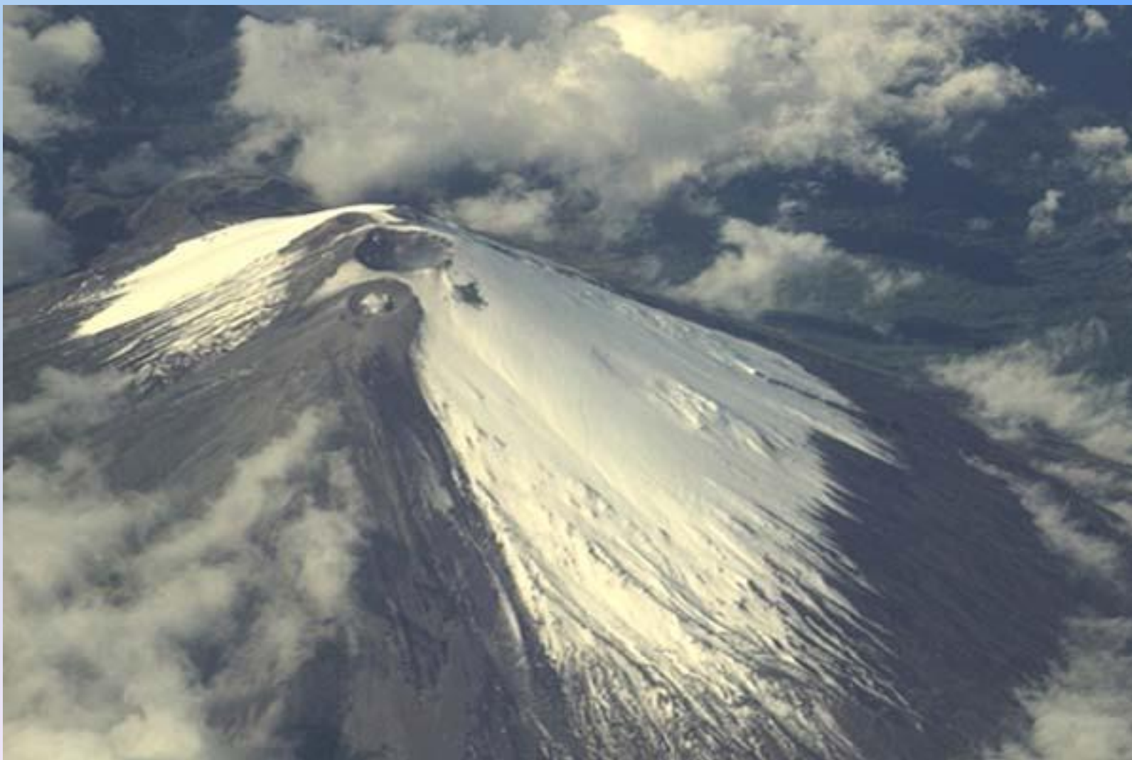
Вулкан в Андах