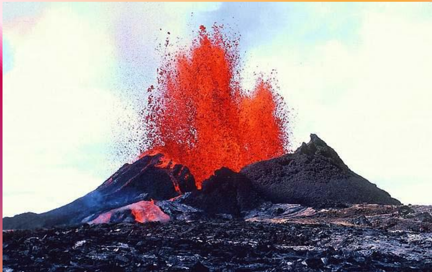
Вулкан Килауза. Гавайские острова