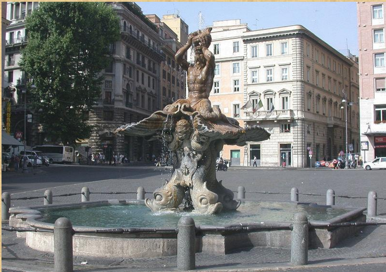
Фонтан Тритона Fontana del Tritone

Страна Италия Местоположение Рим, пiazza Барберини Автор проекта Бернини Строительство 1642 — 1643 годы Состояние действующий фонтан