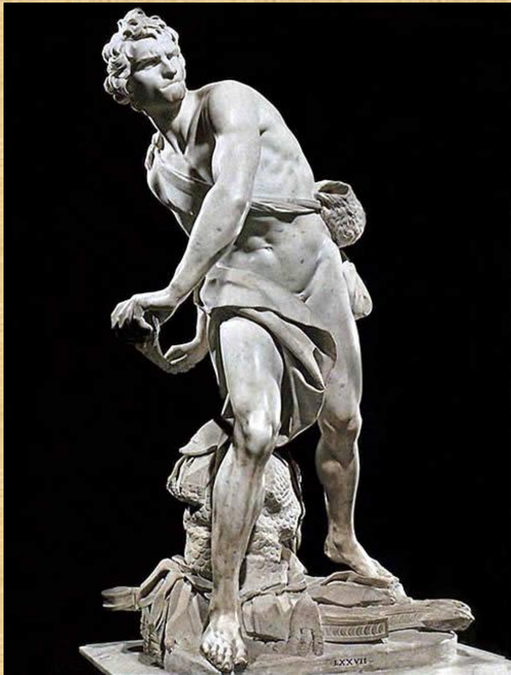
Бернини Лоренцо Джованни Давид 1623 Мрамор Галерея Боргезе, Рим