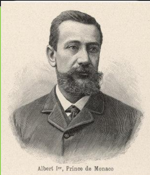
Альберт Шарль Ополе Гримальди