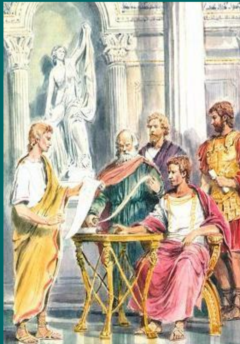
Созиген показывает Юлию Цезарю новый календарь

Названный в честь римского императора Юлия Цезаря . «юлианский» год имеет среднюю длину 365 суток. Однако между истинным солнечным годом и юлианским годом существует заметное расхождение. Истинный солнечный год длится 365 дней 5 часов и 49 минут, так что юлианский год оказался немного длиннее. Вначале на эту неточность не обращали внимания, но постепенно начало весны в календаре все больше смещалось к февралю. В XVI веке астрономическая весна началась не 21, а 11 марта. Необходимо было задуматься о новой реформе календаря!