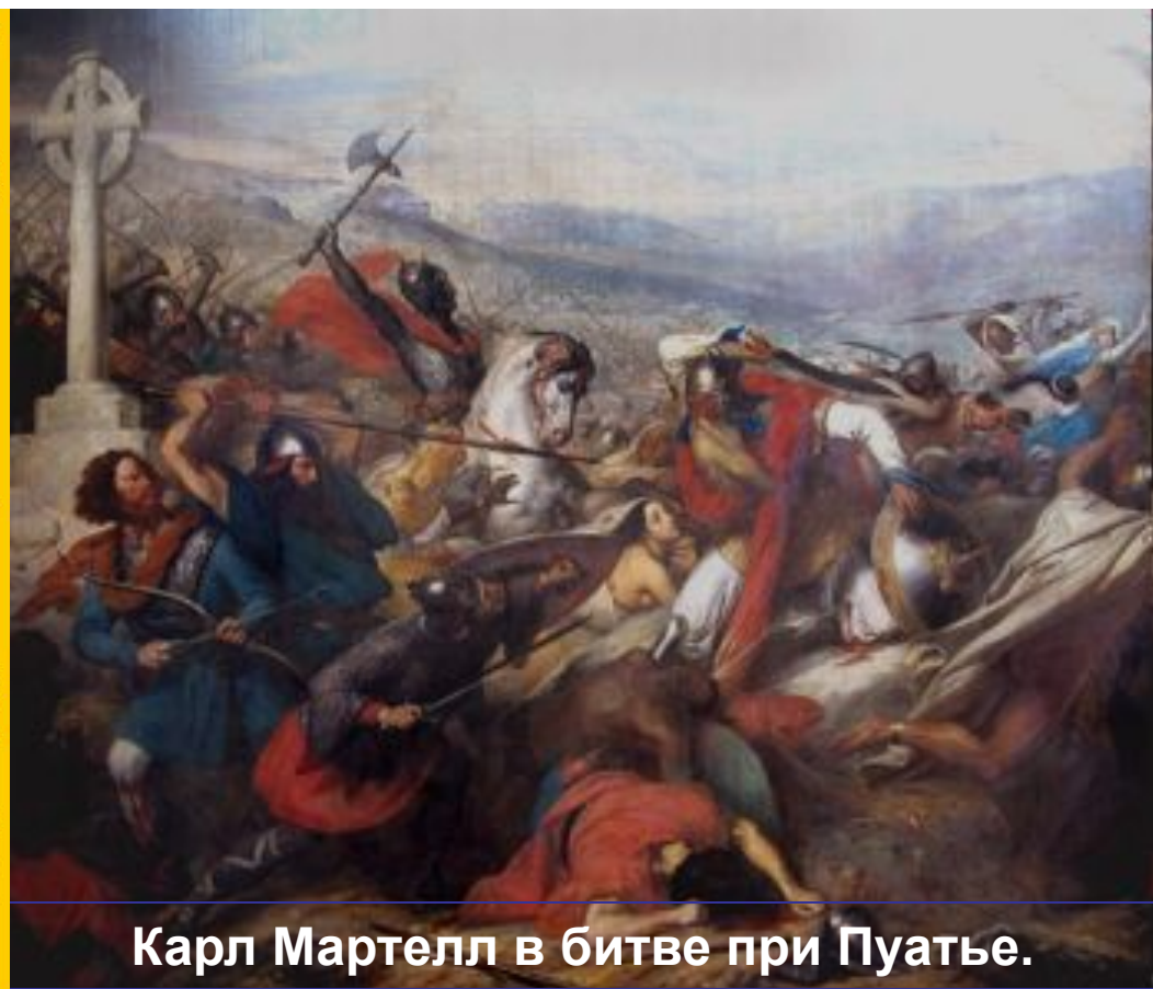
Карл Мартелл в битве при Пуатье.