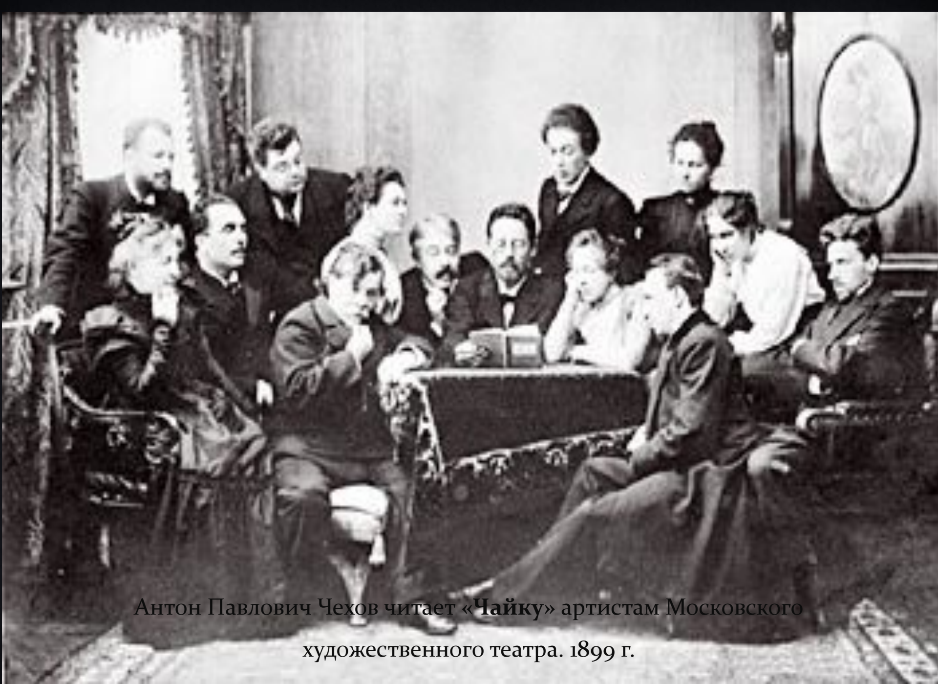
Антон Павлович Чехов читает «Чайку» артистам Московского художественного театра. 1899 г.