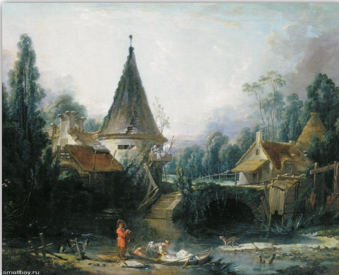
Пейзаж в окрестностях Бовэ 1740-1745. Эрмитаж, Санкт-Петербург.