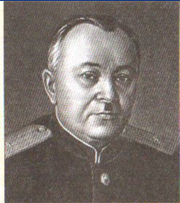
А.В. Александров. Автор музыки гимна нашей страны