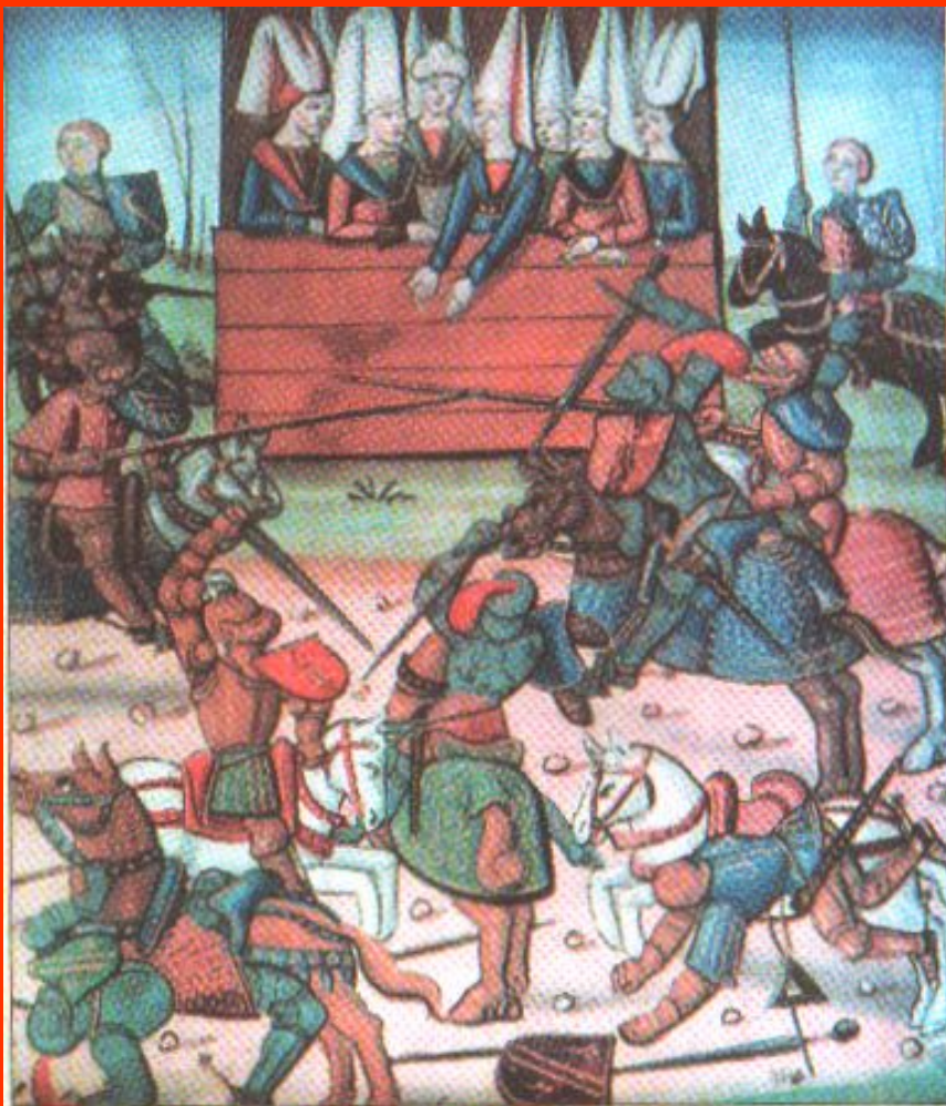
«Рыцарский турнир». Книжная миниатюра. Вторая половина XV в.

В XIII—XV вв. любимым развлечением жителей Западной Европы были состязания воинов-рыцарей. Эти состязания называли рыцарскими турнирами. Лица воинов были полностью закрыты шлемами. Для зрителей они оставались неузнаваемыми. Тогда и появилась необходимость на одежде или доспехах участника турнира помещать отличительный знак — герб, принадлежавший только ему.