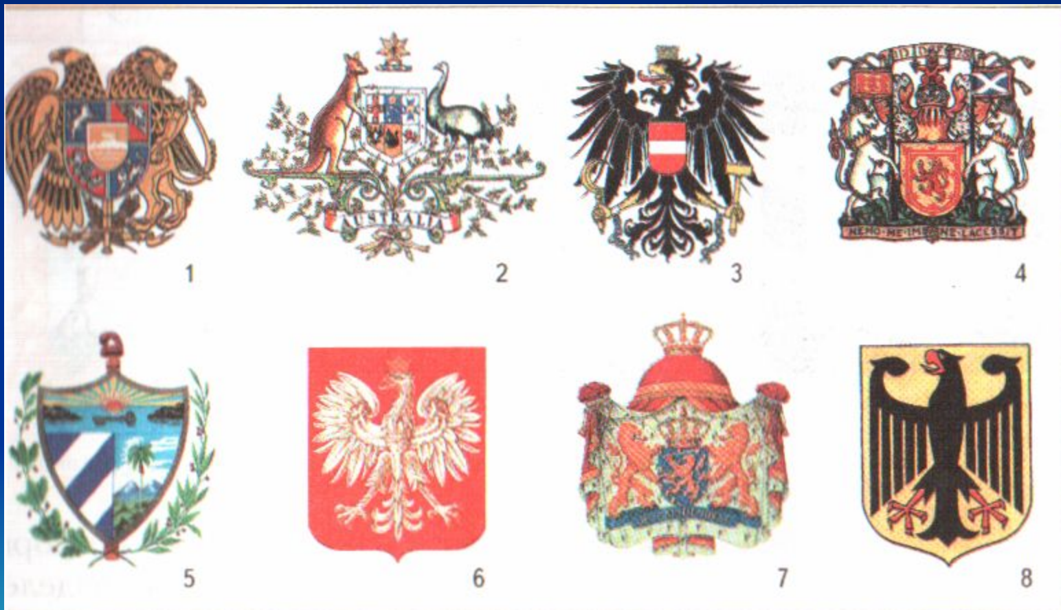
Изображения гербов иностранных государств: 1 — Армения; 2 — Австралия; 3 — Австрия; 4 — Шотландия; 5 — Куба; 6 — Польша; 7 — Нидерланды; 8 — Германия