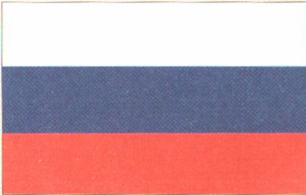
Флаг Российской Федерации