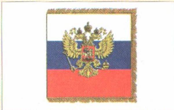
Штандарт Президента Российской Федерации