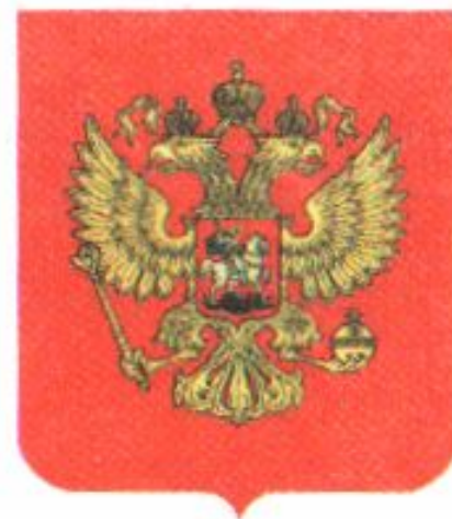
Герб Российской Федерации. 1991 г.