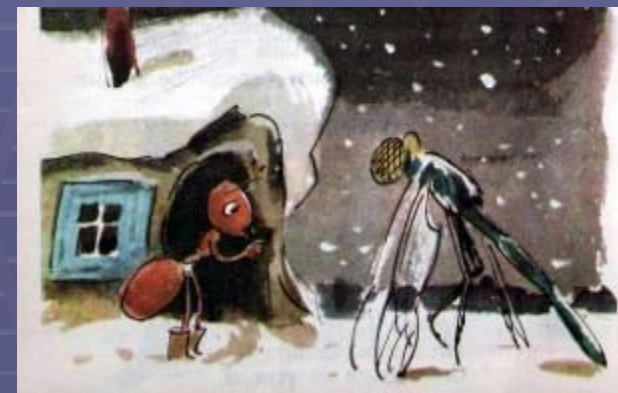
Стрекоза и Муравей