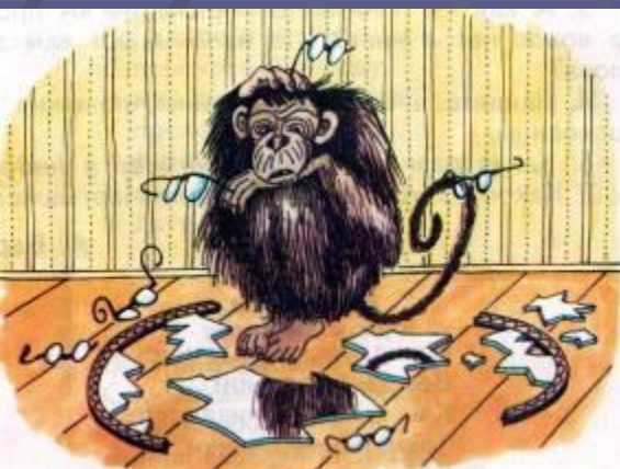
Мартышка и очки