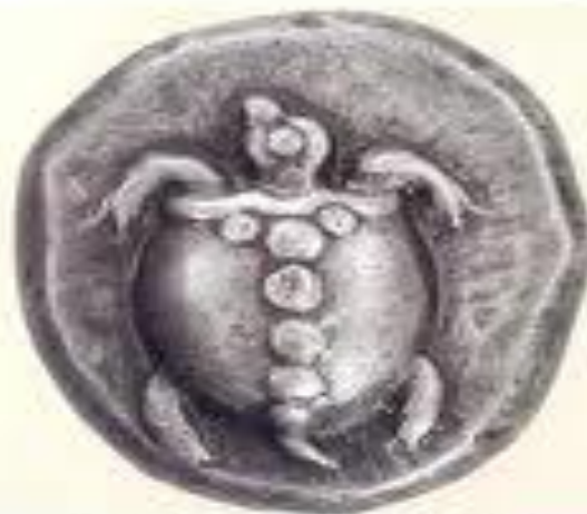
Статер Згнна, 480-е гг. до н.э. Серебро, диаметр 24 мм, вес 19 гр.