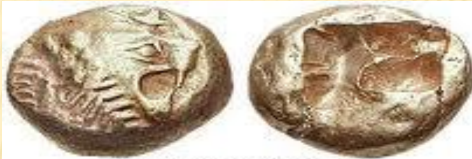
Лидийская монета, 610-600 гг. до н.э. Злектр, макс. размер 13 мм, вес 4,70 гр.