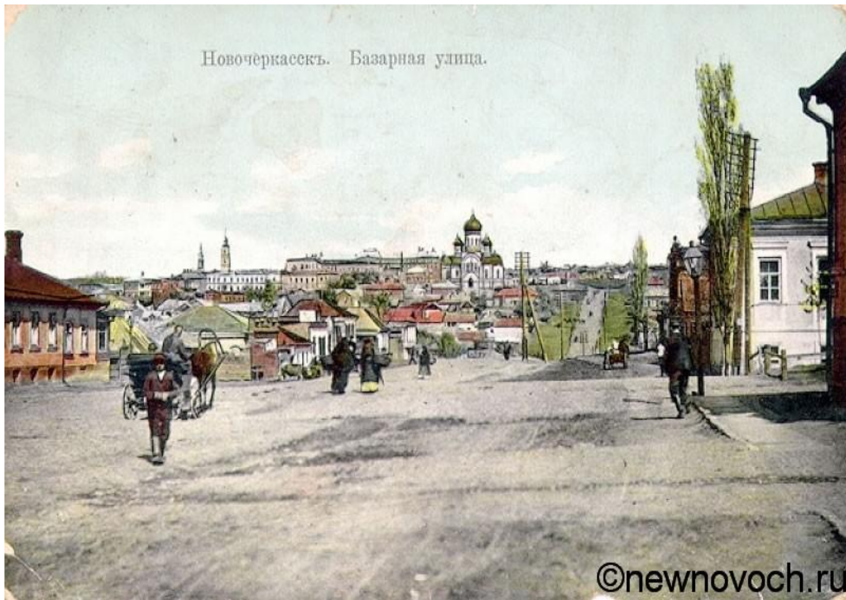
Новочеркасскъ. Базарная улица.